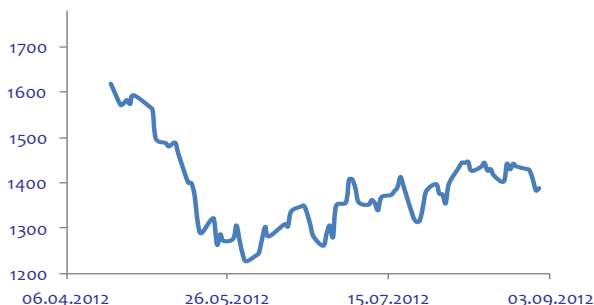
График индекса РТС

Мы рекомендуем продолжать удерживать открытые ранее короткие позиции. Поскольку по ходу дня значительного снижения может не произойти, новые шорты до 18-00 по Москве (начало выступления руководителя ФРС) может быть преждевременным. В понедельник биржи США не торгуются, поэтому основное движение в последние 45 минут сессии может быть отыграно на российском «с запасом», так что волатильность под конец дня будет повышенной.