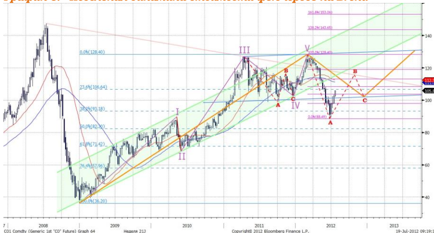
График 3. Недельная динамика стоимости фьючерсов на Brent.

В долгосрочной перспективе формируется плоская коррекция, как следует из графика 3. Минимальная точка коррекции уже достигнута. Ждем роста котировок Brent к отметке $115.