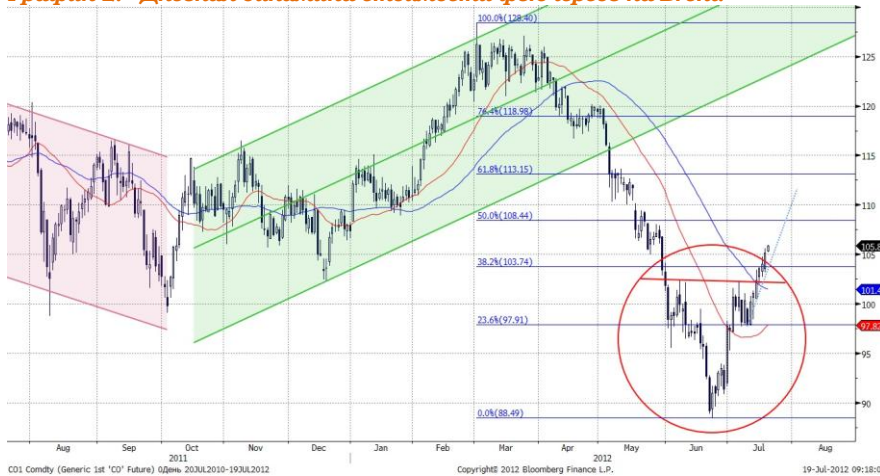
График 2. Дневная динамика стоимости фьючерсов на Brent.

В среднесрочной перспективе, смягчение кредитно-денежной политики, которое предприняли ЕЦБ и НБК, а также ожидаемые шаги ФРС по продолжению количественного смягчения поддержат цены на нефть.