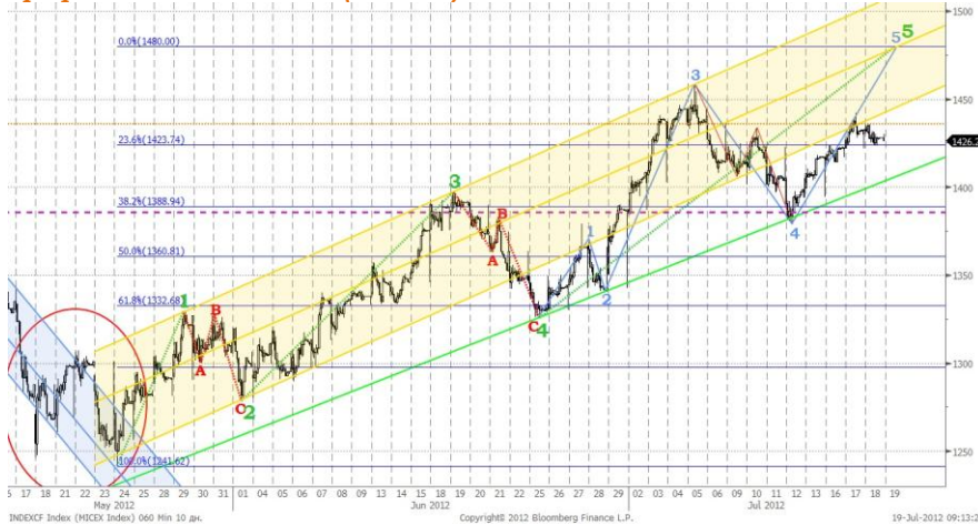
График 1. Индекс ММВБ (часовой).

Индекс ММВБ продолжает формировать пятиволновое восходящее движение. Сегодня ожидаем роста индекса к уровню 1445 пунктов. Полагаем, целью волны 5 будет отметка 1480 пунктов.