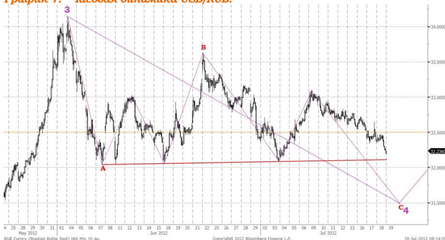
График 7. Часовая динамика USD/RUB.

Дорожающая нефть, ослабшийся во второй половине вчерашнего дня доллар, растущие азиатские индексы, а также дорожающие контракты на американские индексы будут способствовать сегодня укреплению рубля.