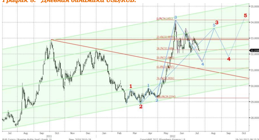
График 8. Дневная динамика USD/RUB.

Предполагаемая структура динамики соотношения доллара США и российской валюты в среднесрочной перспективе изображена на графиках 7 и 8.