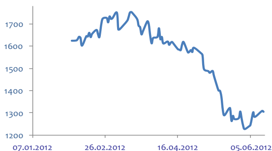
График индекса РТС

Торговую активность по-прежнему рекомендуем сохранять в обыкновенных акциях Сбербанка. Завтра к вечеру маргинальные позиции стоит зарыть.