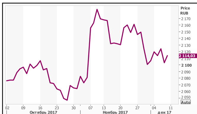
График индекса ММВБ (60 мин.)