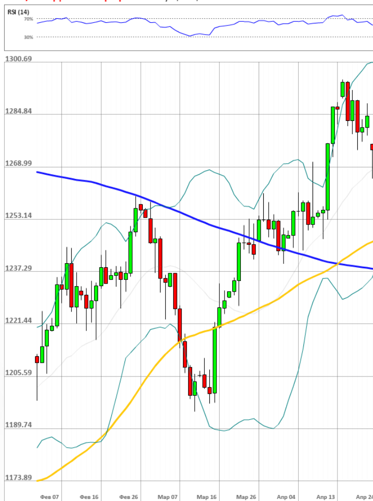
XAU/USD Дневной график Текущая цена 1272.63