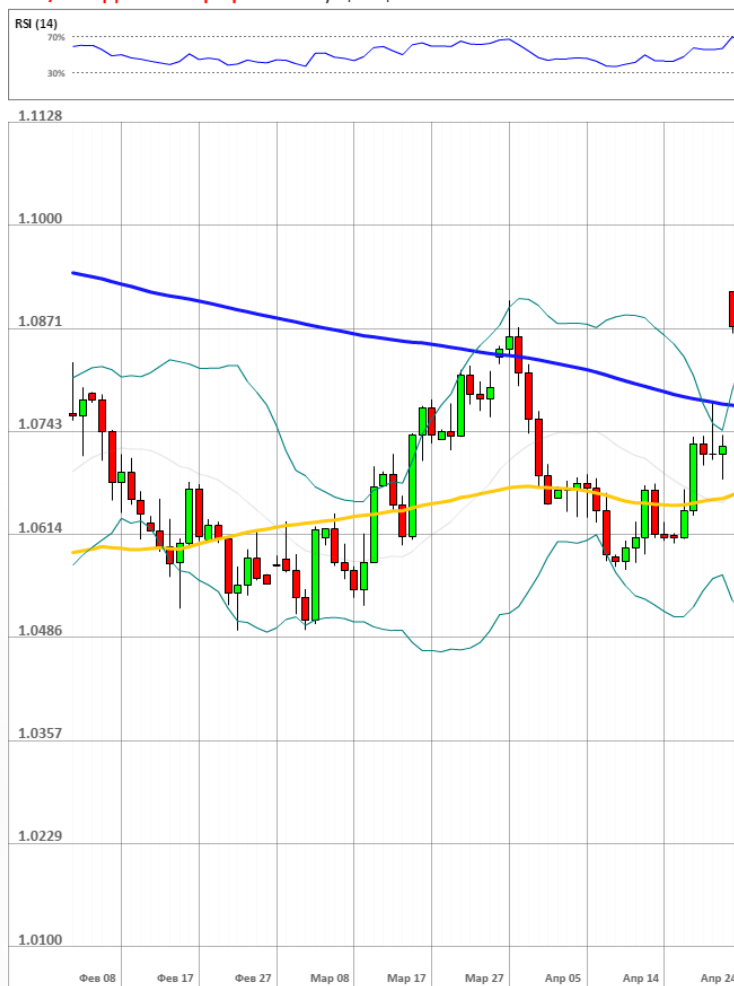
EUR/USD Дневной график Текущая цена 1.0849