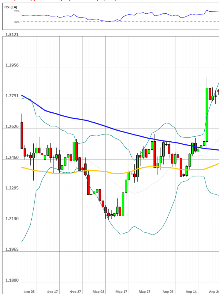
GBP/USD Дневной график Текущая цена 1.2796