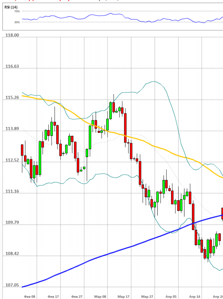
USD/JPY Дневной график Текущая цена 110.07