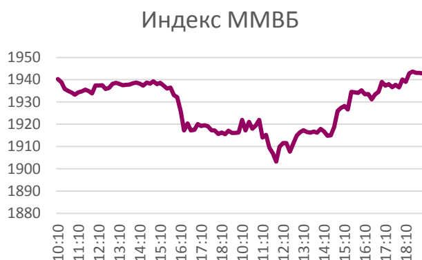
График индекса ММББ