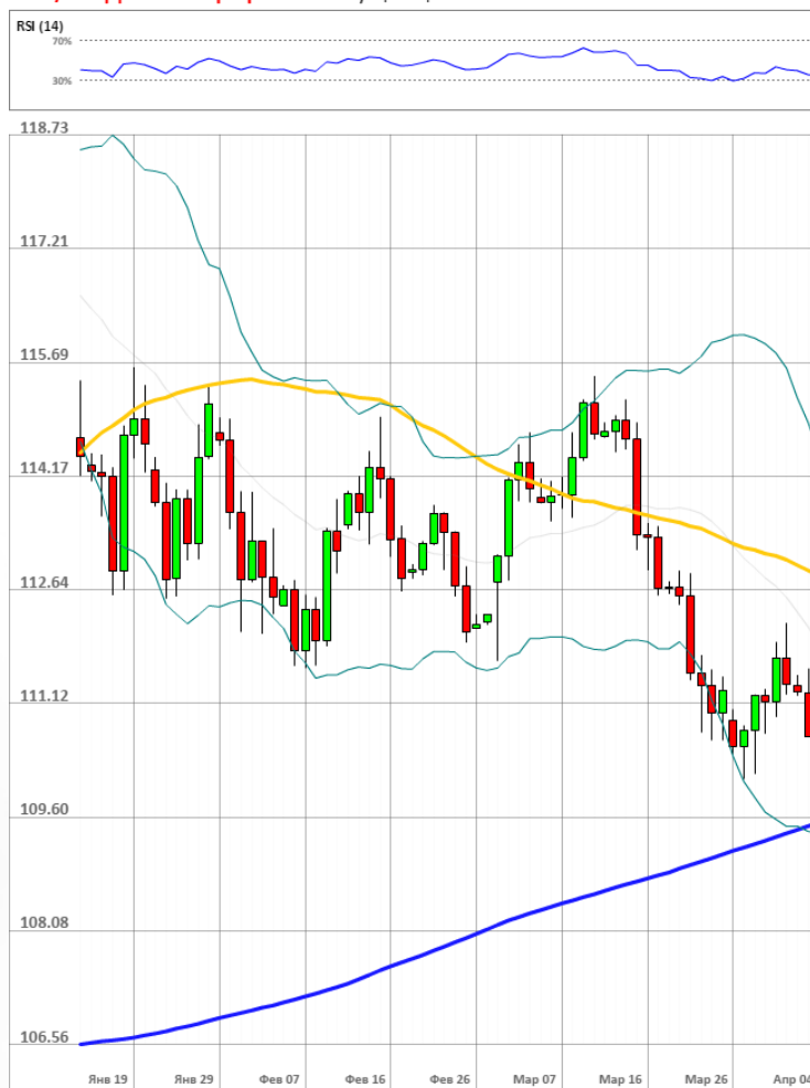
USD/JPY Дневной график Текущая цена 110.49