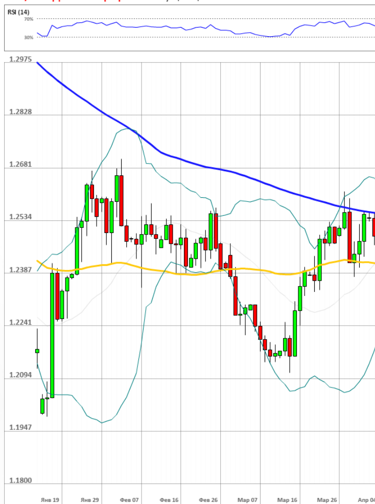
GBP/USD Дневной график Текущая цена 1.2431