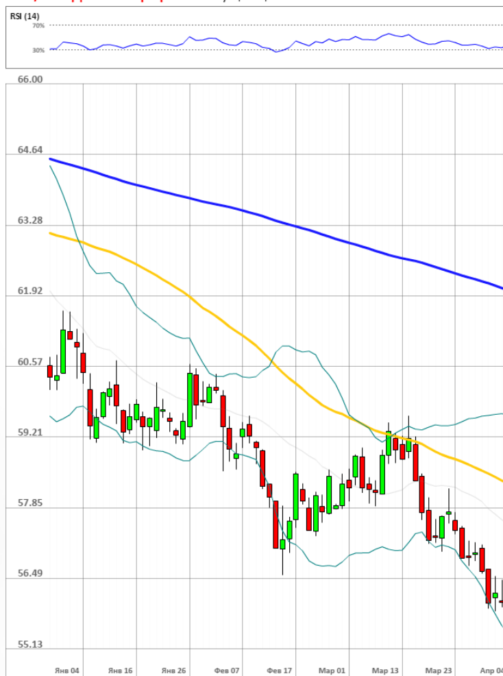
USD/RUB Дневной график Текущая цена 56.36