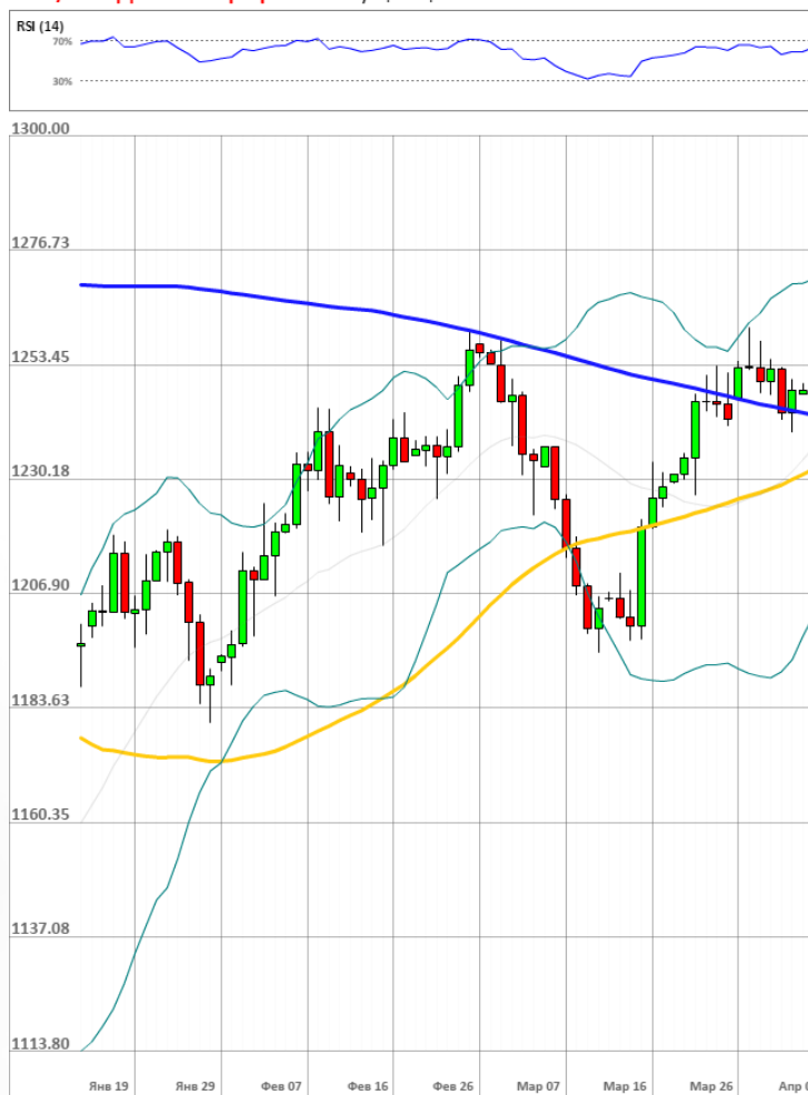
XAU/USD Дневной график Текущая цена 1257.44