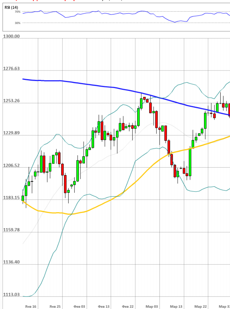
XAU/USD Дневной график Текущая цена 1242.52

Доля длинных позиций на рынке SWFX упала и на данный момент равна 48%.