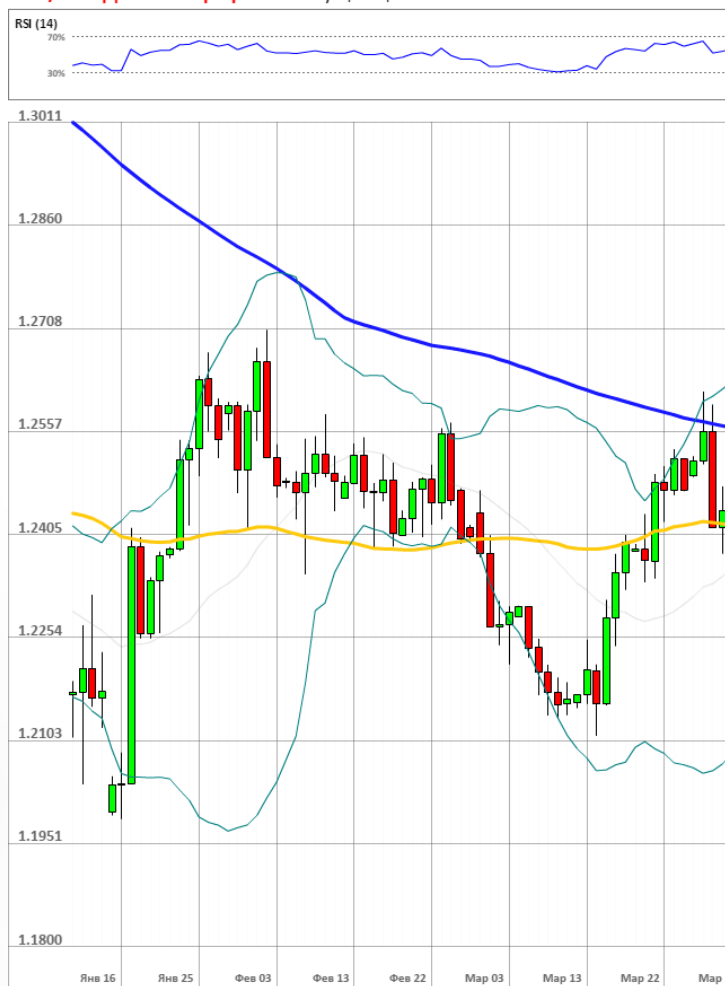
GBP/USD Дневной график Текущая цена 1.2455