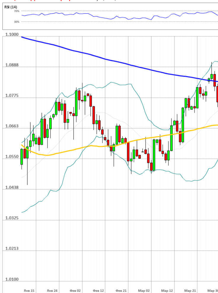
EUR/USD Дневной график Текущая цена 1.0737