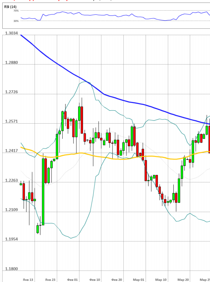
GBP/USD Дневной график Текущая цена 1.2442