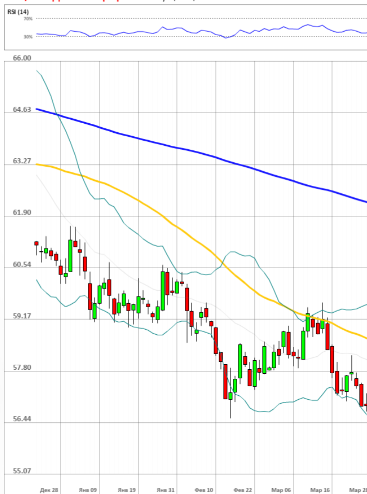
USD/RUB Дневной график Текущая цена 57.07

«Пока американский доллар слаб, а нефтяные котировки перешли к росту, у рубля есть небольшой шанс обновить свои максимумы против иностранных валют. На вторник для пары доллар/рубль цель на уровне 56,55, евро/рубль – 61,45». - Владислав Антонов (по материалам investing.com)