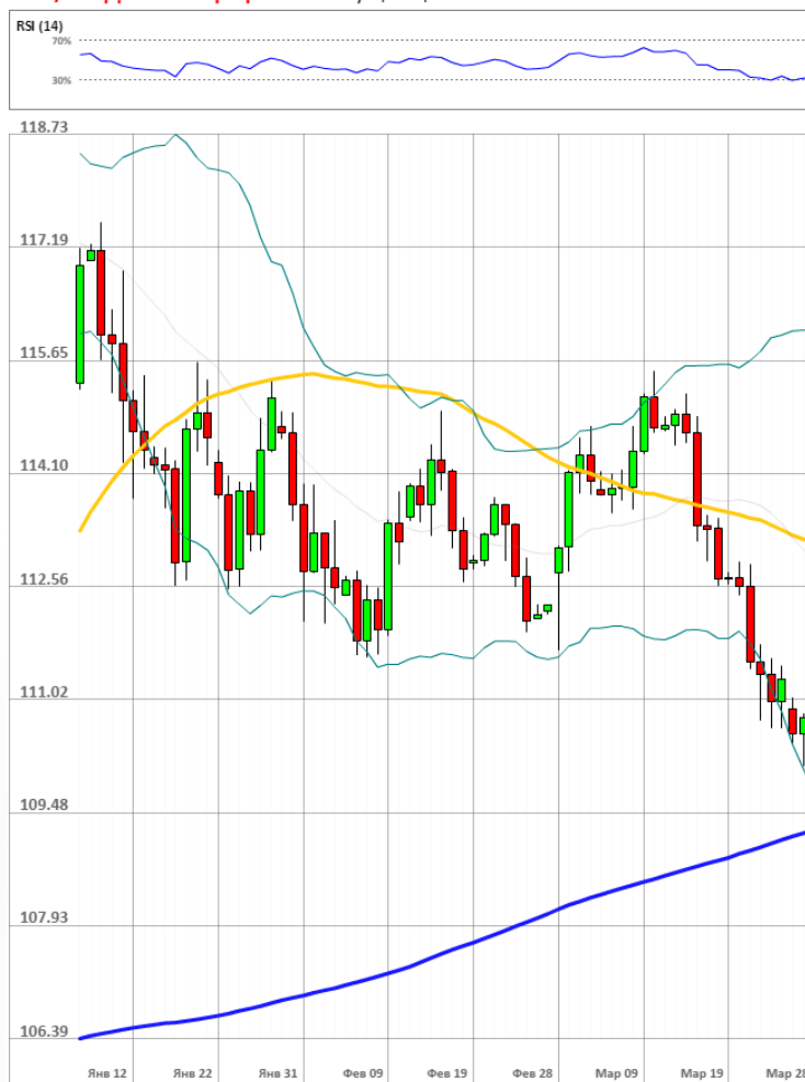
USD/JPY Дневной график Текущая цена 110.69