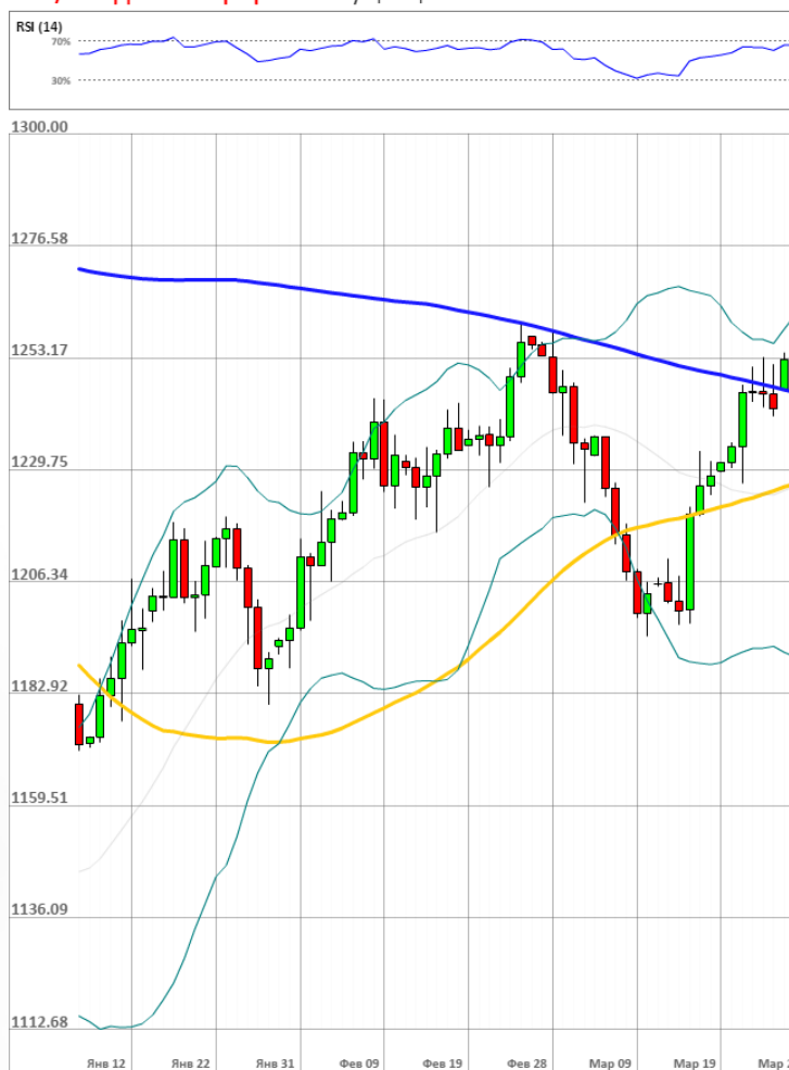
XAU/USD Дневной график Текущая цена 1253.09

Доля длинных позиций на рынке SWFX упала и на данный момент равна 49%.