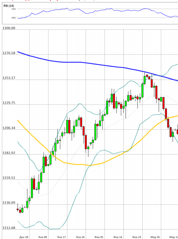
XAU/USD Дневной график Текущая цена 1201.10

Доля длинных позиций на рынке SWFX осталась неизменной и на данный момент равняется 52%.