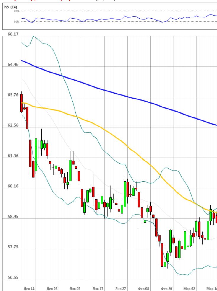
USD/RUB Дневной график Текущая цена 59.01