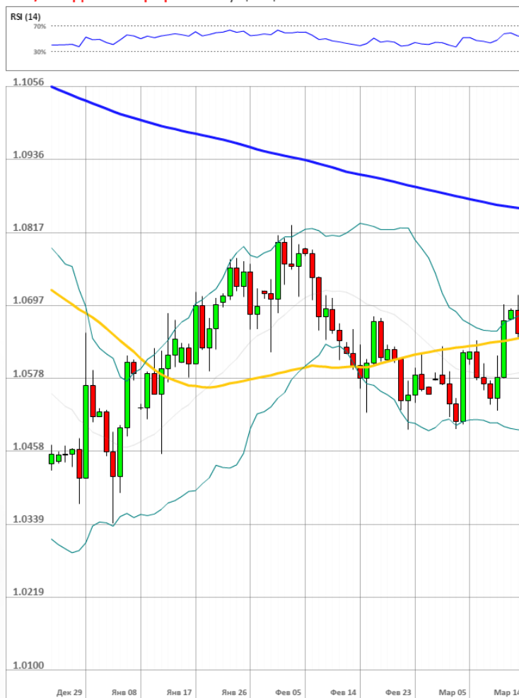
EUR/USD Дневной график Текущая цена 1.0639