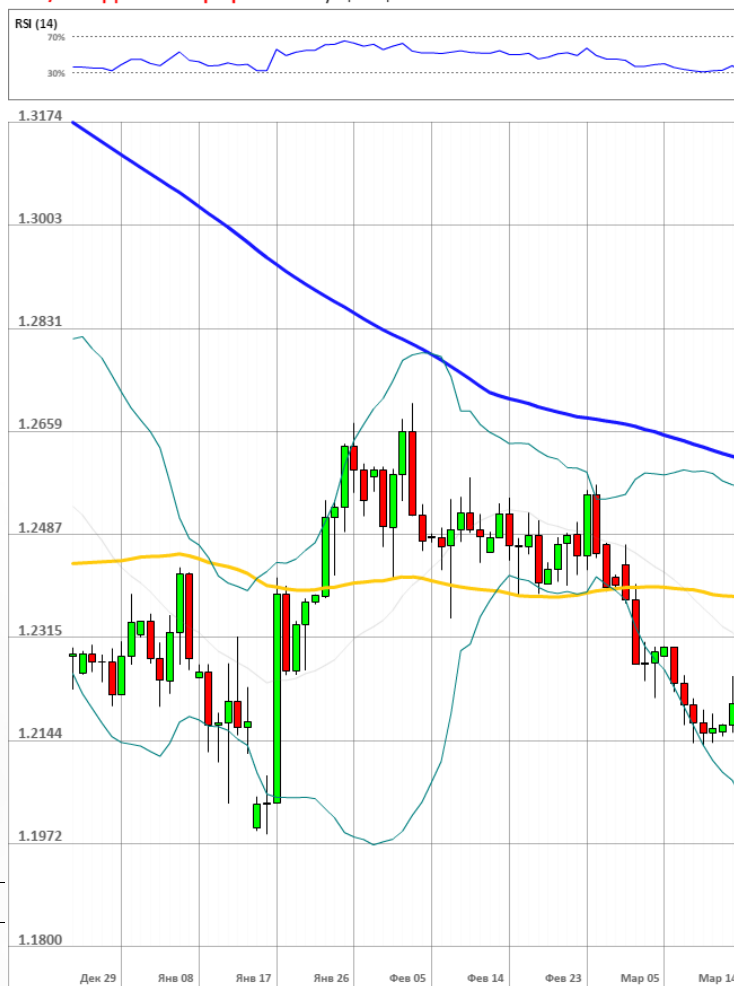
GBP/USD Дневной график Текущая цена 1.2113