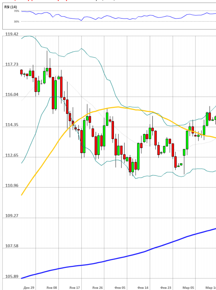
USD/JPY Дневной график Текущая цена 115.15