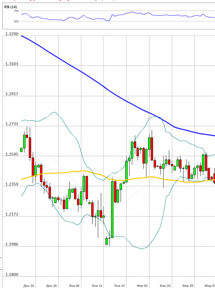
GBP/USD Дневной график Текущая цена 1.2356

Доля длинных позиций на рынке SWFX упала и на данный момент равняется 59%.