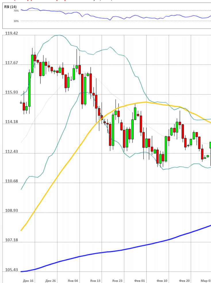
USD/JPY Дневной график Текущая цена 113.62

Доля длинных позиций на рынке SWFX выросла и на данный момент равняется 66%.