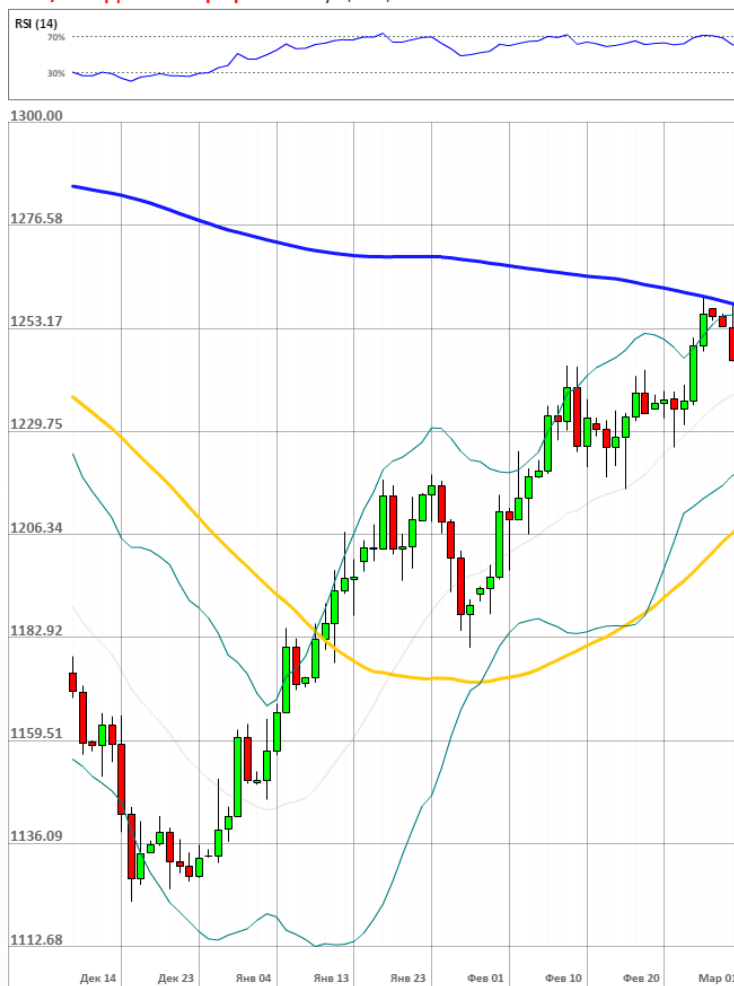
XAU/USD Дневной график Текущая цена 1243.05

Доля длинных позиций на рынке SWFX осталась неизменной и на данный момент равняется 53%.