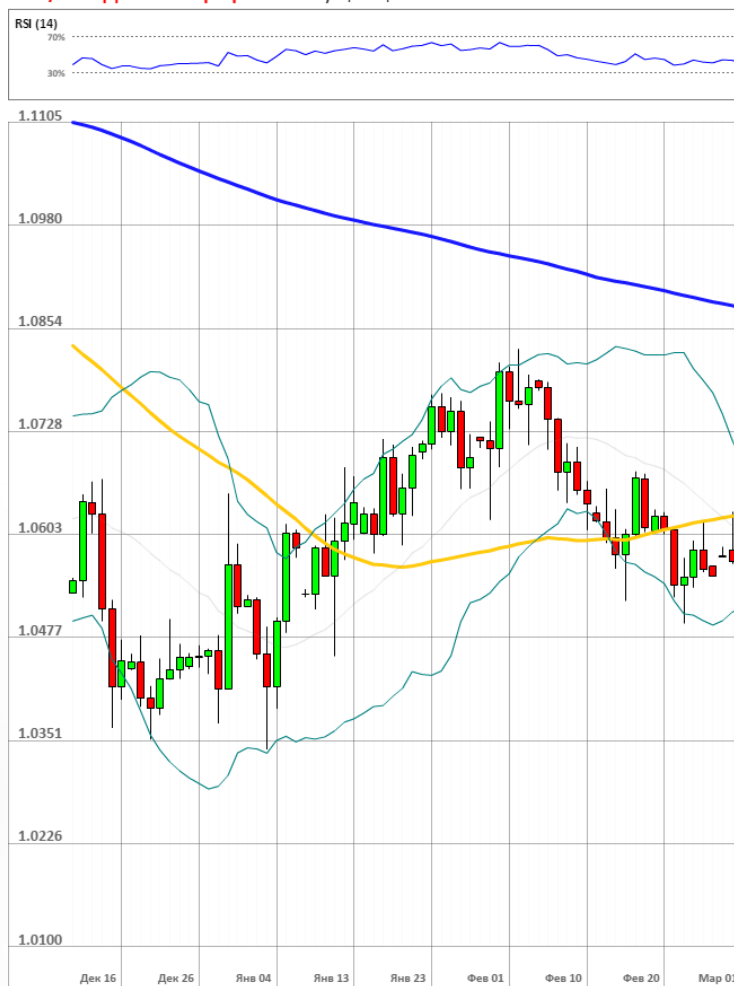
EUR/USD Дневной график Текущая цена 1.0542