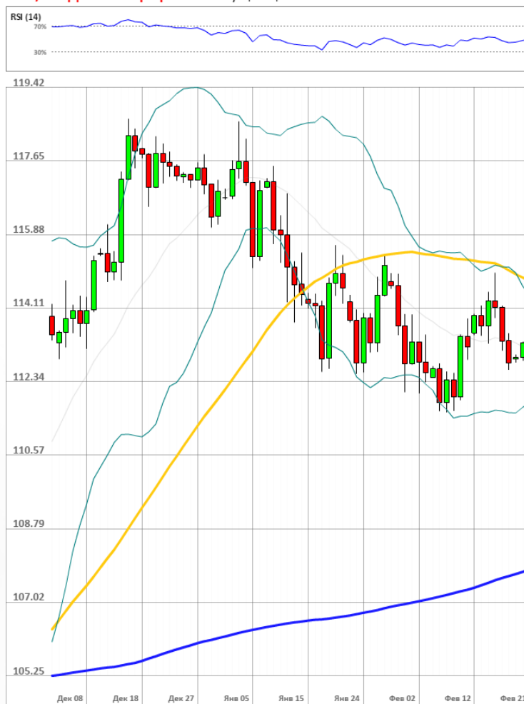
USD/JPY Дневной график Текущая цена 113.54

Доля длинных позиций на рынке SWFX упала и на данный момент равняется 56%.