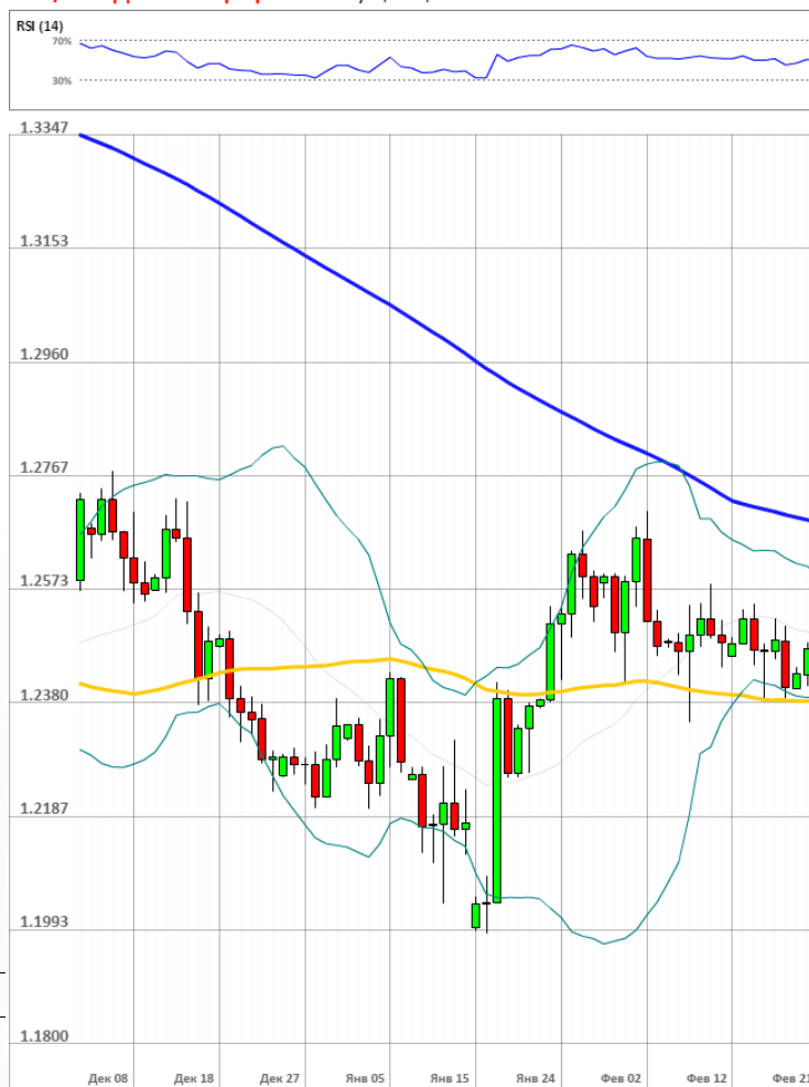
GBP/USD Дневной график Текущая цена 1.2453