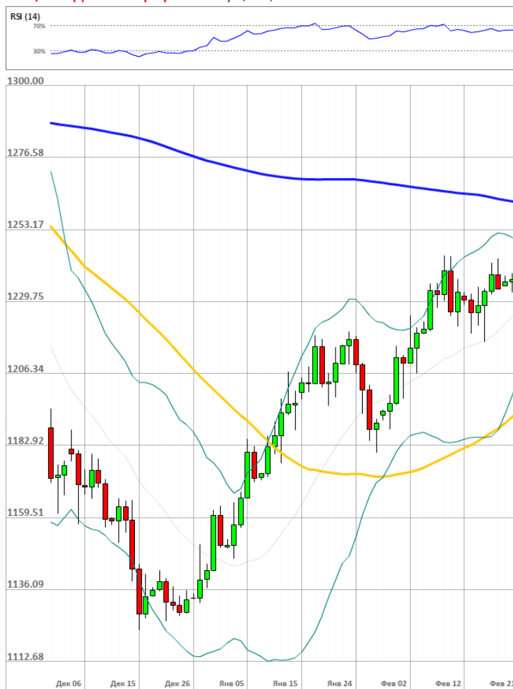
XAU/USD Дневной график Текущая цена 1233.81

Доля длинных позиций на рынке SWFX осталась неизменной и на данный момент равняется 54%.