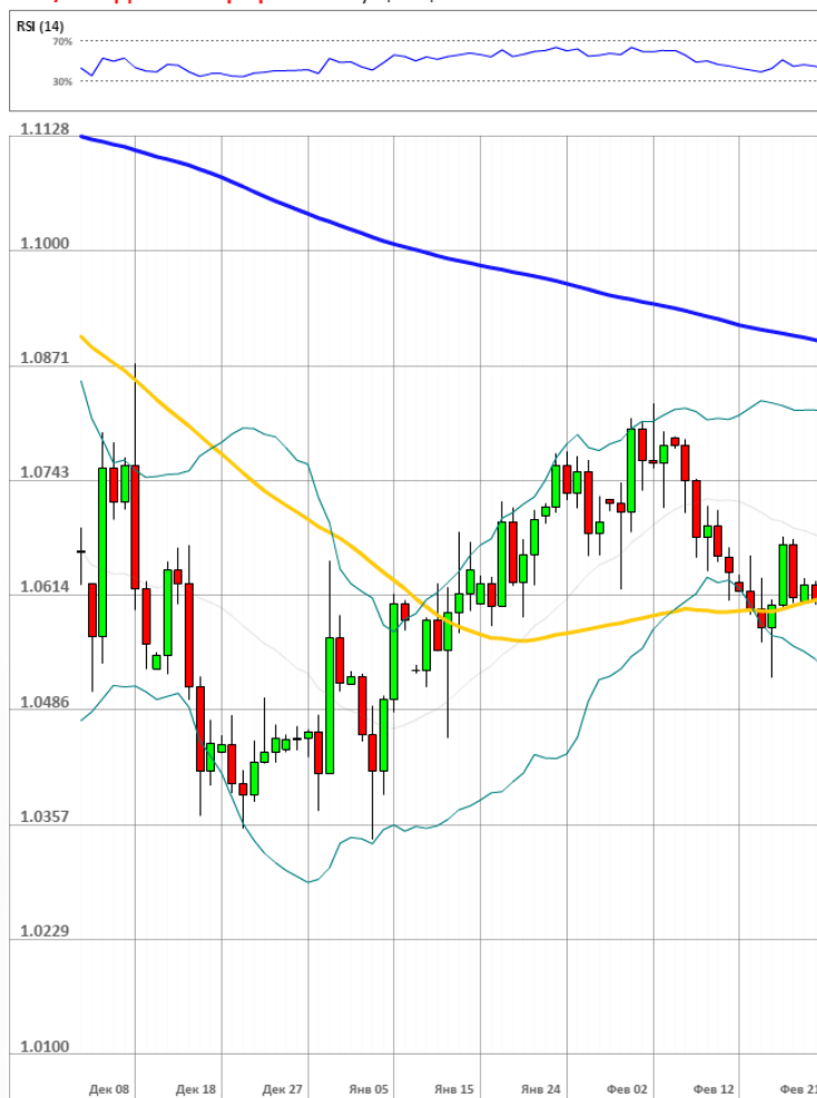
EUR/USD Дневной график Текущая цена 1.0584