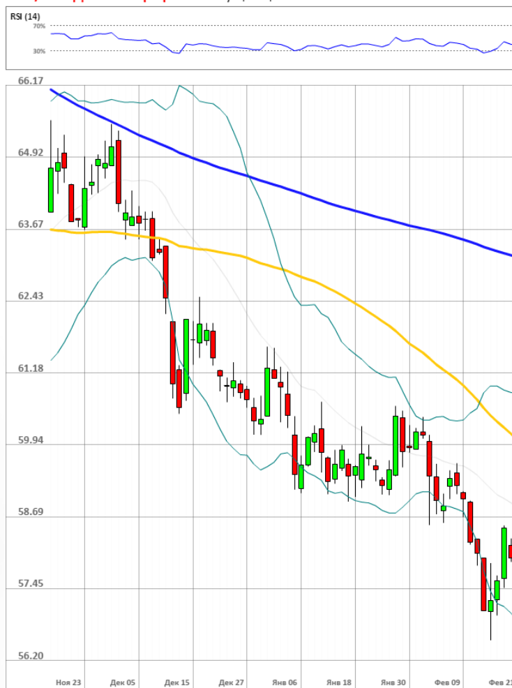
USD/RUB Дневной график Текущая цена 57.82

Доля длинных позиций на рынке SWFX упала и на данный момент равна 74%.