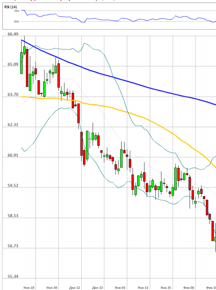
USD/RUB Дневной график Текущая цена 57.18