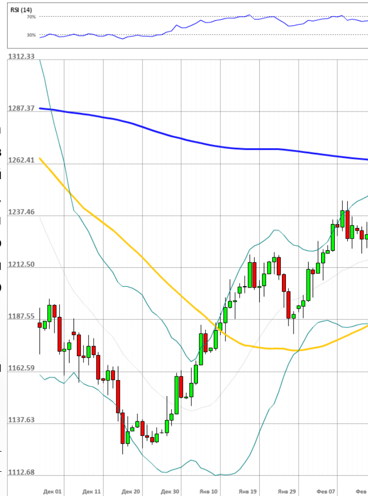
XAU/USD Дневной график Текущая цена 1236.39

«Потенциал роста стоимости золота сдерживается заявлениями главы ФРС США Йеллен о необходимости увеличить базовую процентную ставку. Драгметалл чувствителен к повышению учетной ставки США, поскольку эта мера приведет к удорожанию американской валюты». -1prime.ru (по материалам 1prime.ru)