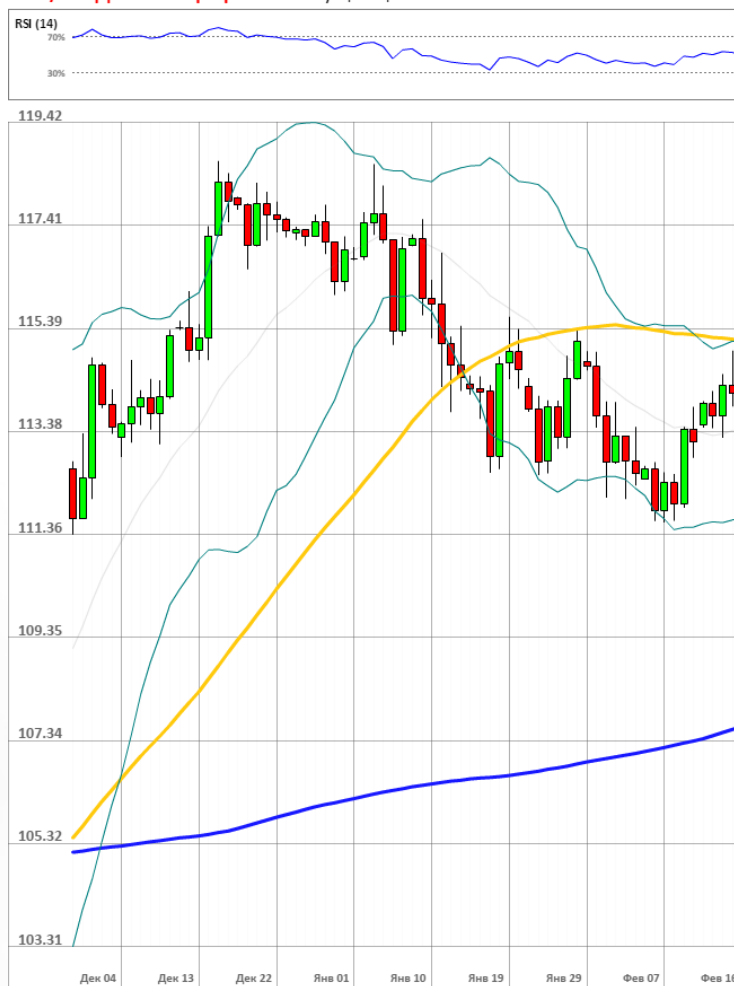
USD/JPY Дневной график Текущая цена 113.72

Доля длинных позиций на рынке SWFX упала и на данный момент равняется 56%.