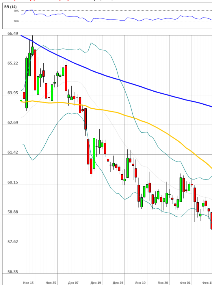
USD/RUB Дневной график Текущая цена 58.03