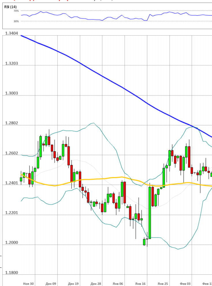
GBP/USD Дневной график Текущая цена 1.2526