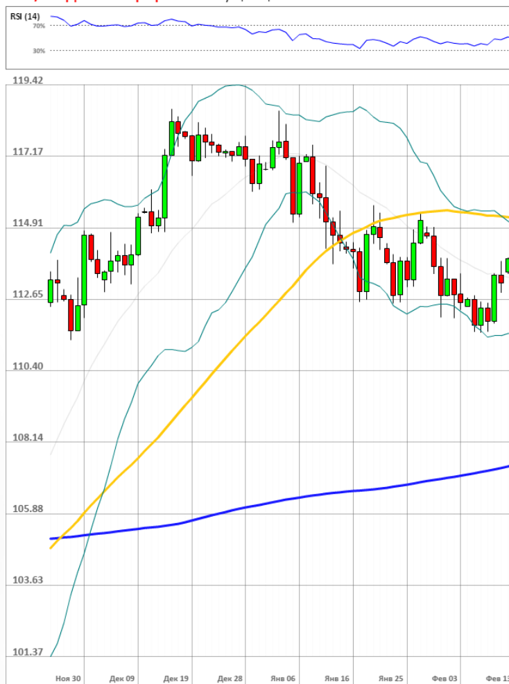
USD/JPY Дневной график Текущая цена 113.63