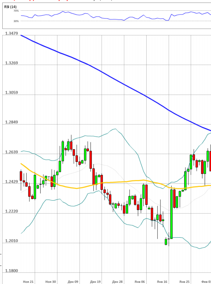
GBP/USD Дневной график Текущая цена 1.2525

Доля длинных позиций на рынке SWFX выросла и на данный момент равняется 60%.