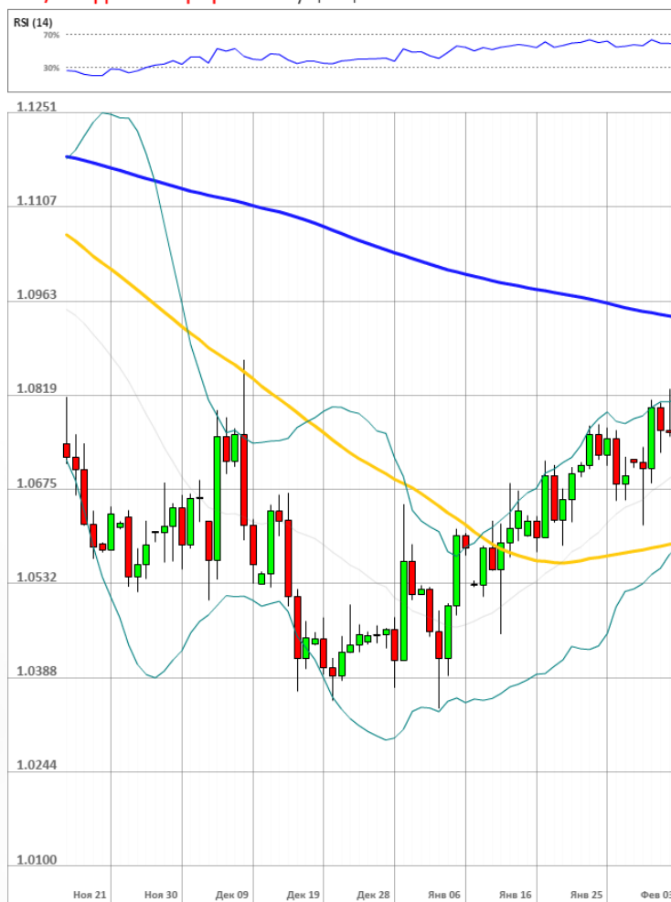
EUR/USD Дневной график Текущая цена 1.0764