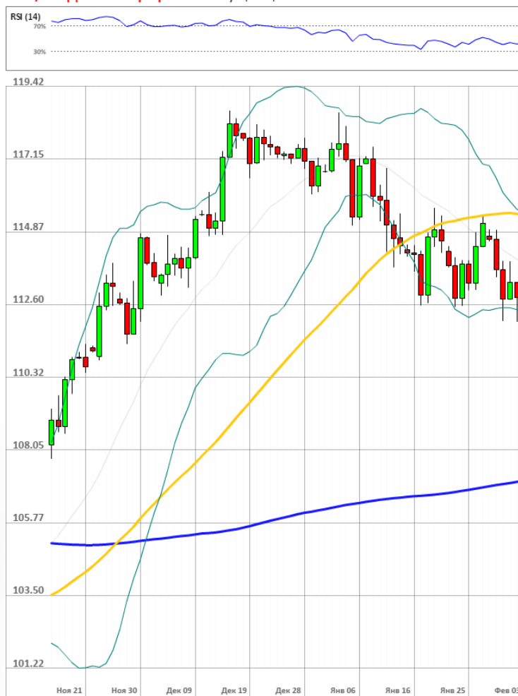
USD/JPY Дневной график Текущая цена 113.11

Доля длинных позиций на рынке SWFX выросла и на данный момент равняется 61%.