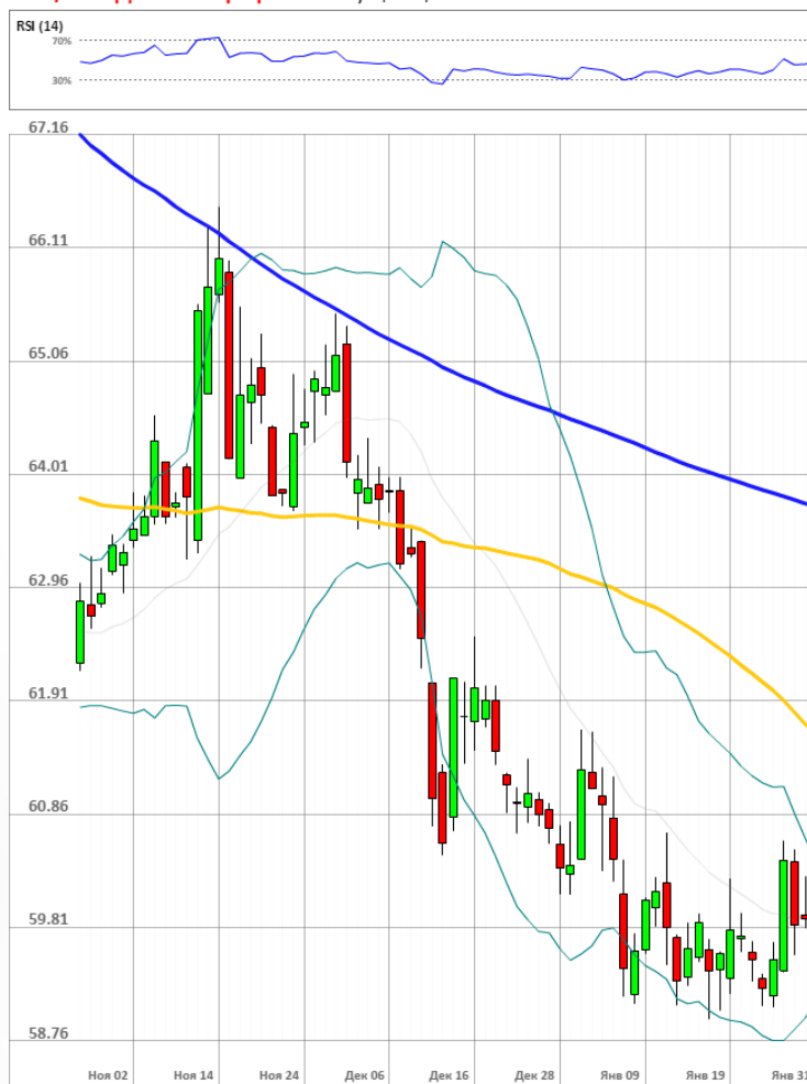
USD/RUB Дневной график Текущая цена 60.08