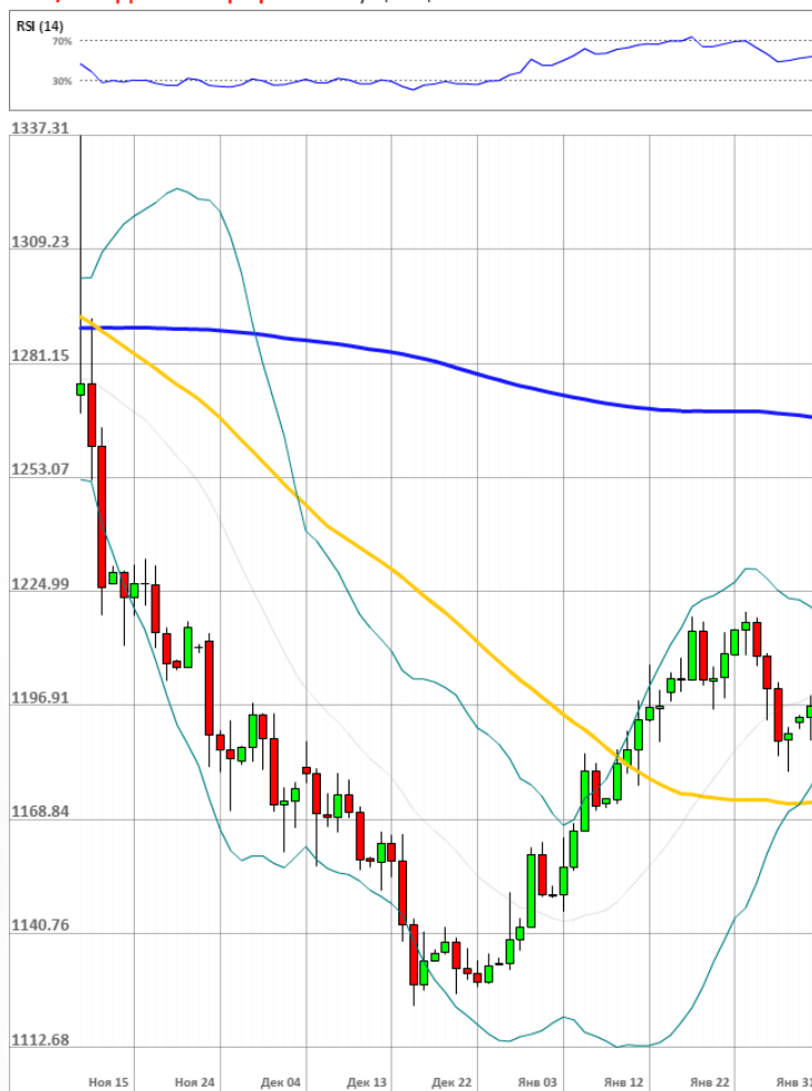
XAU/USD Дневной график Текущая цена 1199.78

Доля длинных позиций на рынке SWFX осталась неизменной и на данный момент равняется 51%.