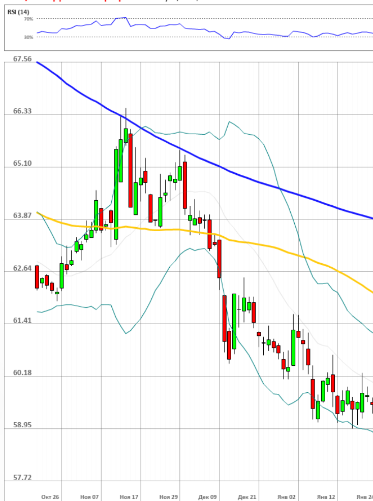
USD/RUB Дневной график Текущая цена 59.15