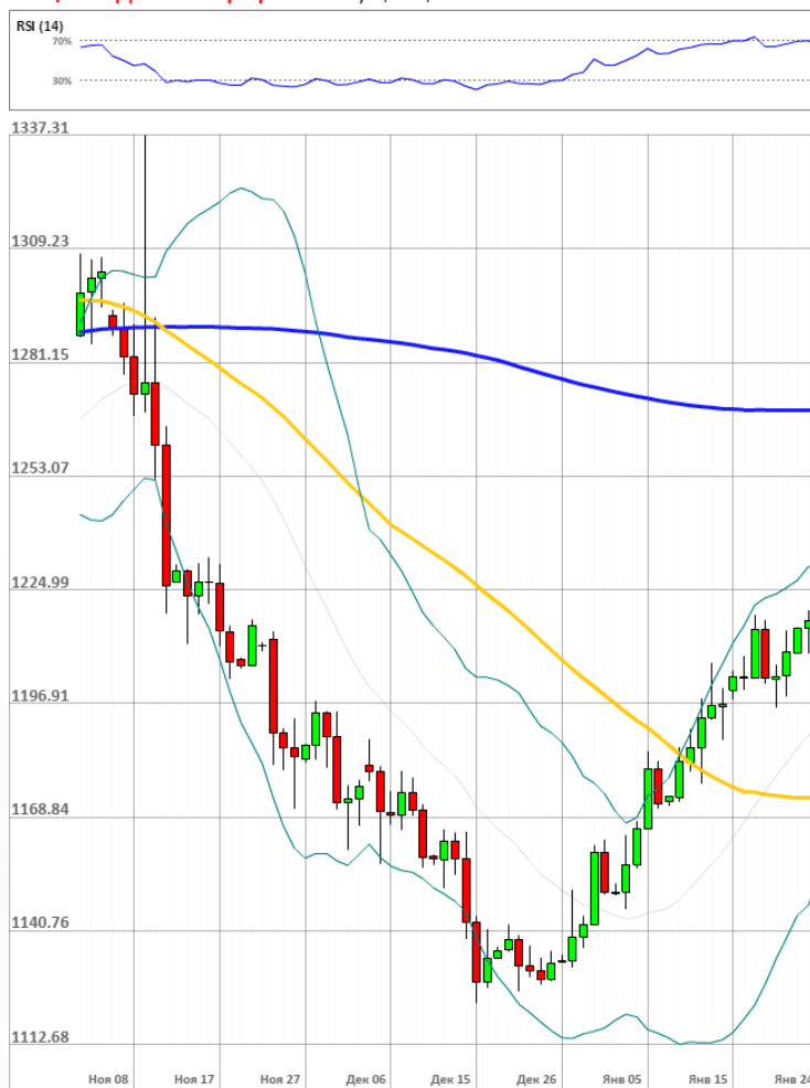
XAU/USD Дневной график Текущая цена 1213.17

Доля длинных позиций на рынке SWFX осталась неизменной и на данный момент равняется 52%.