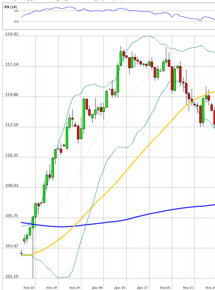
USD/JPY Дневной график Текущая цена 113.30