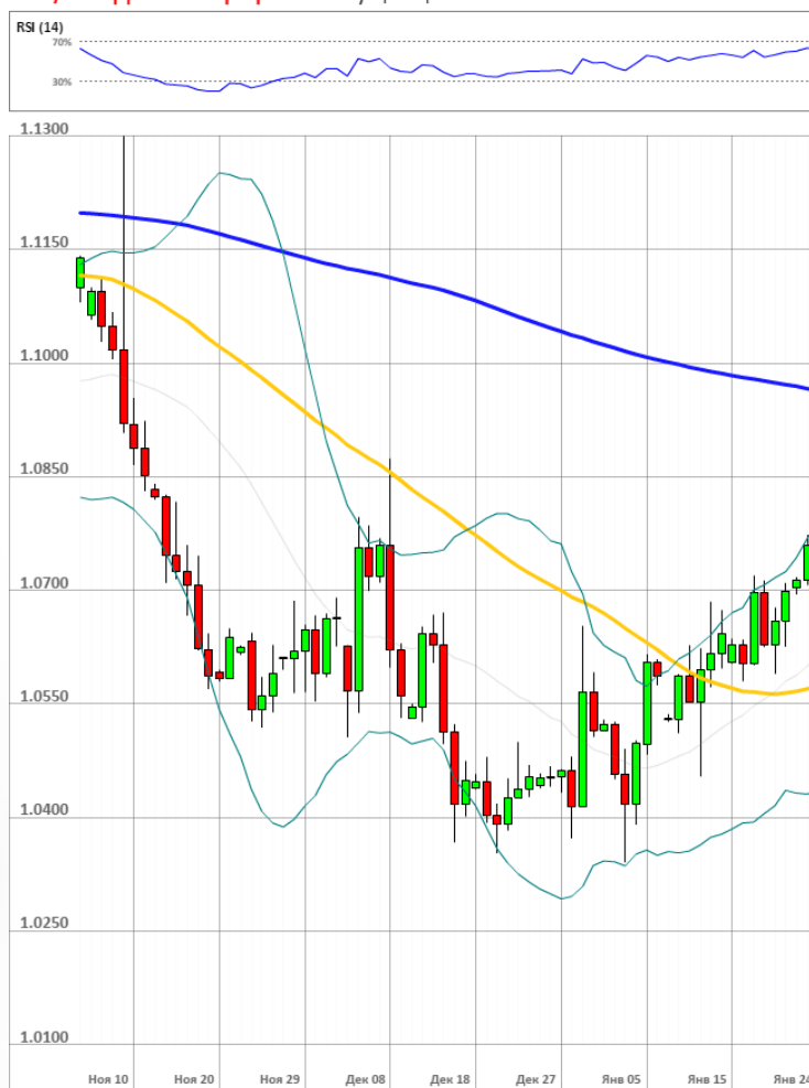
EUR/USD Дневной график Текущая цена 1.0748

Доля длинных позиций на рынке SWFX упала и на данный момент равняется 46%.