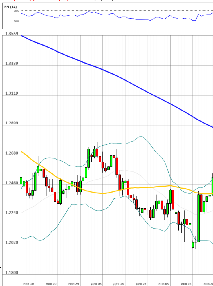
GBP/USD Дневной график Текущая цена 1.2482