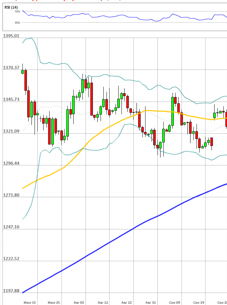
XAU/USD Дневной график Текущая цена 1325.89