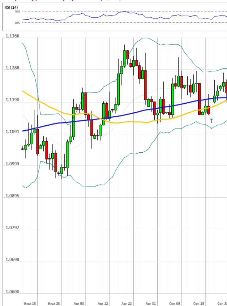
EUR/USD Дневной график Текущая цена 1.1211