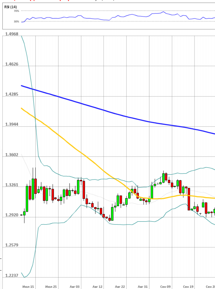
GBP/USD Дневной график Текущая цена 1.3004