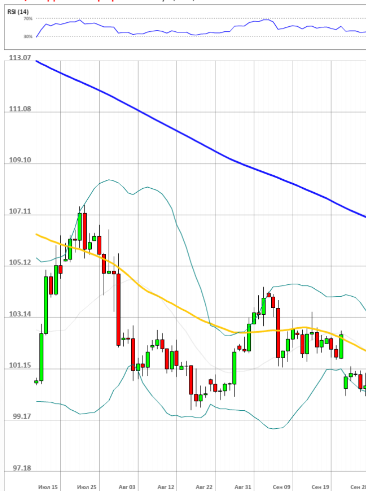
USD/JPY Дневной график Текущая цена 100.61