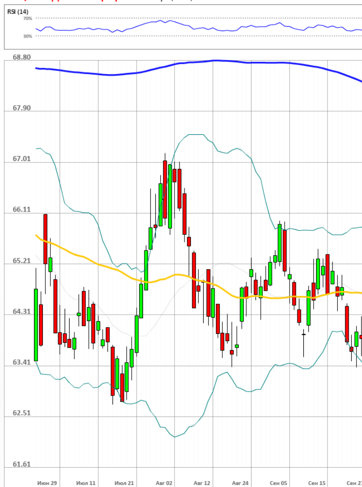
USD/RUB Дневной график Текущая цена 63.81