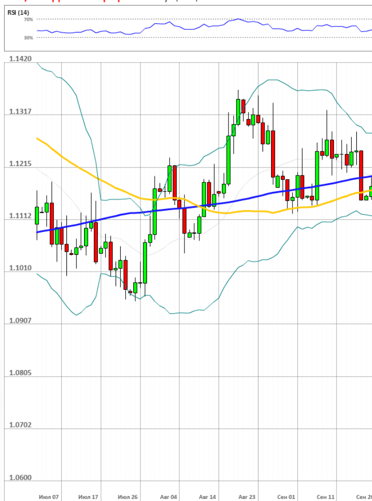
EUR/USD Дневной график Текущая цена 1.1174