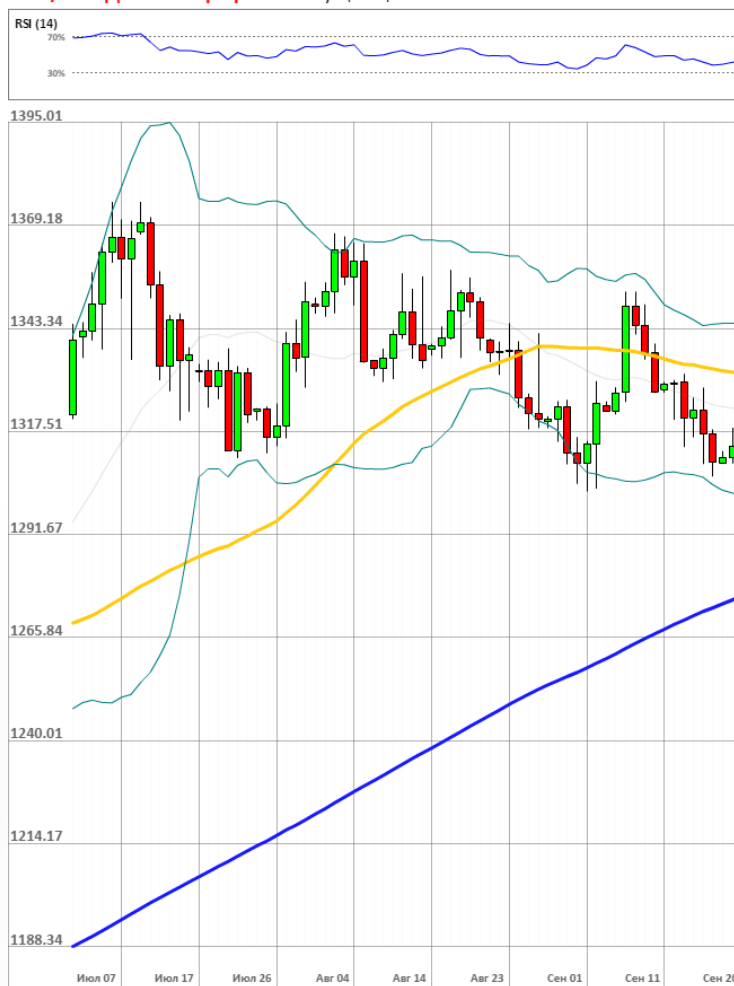
XAU/USD Дневной график Текущая цена 1315.96