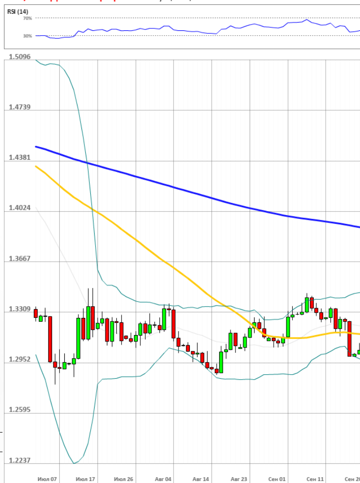
GBP/USD Дневной график Текущая цена 1.3040