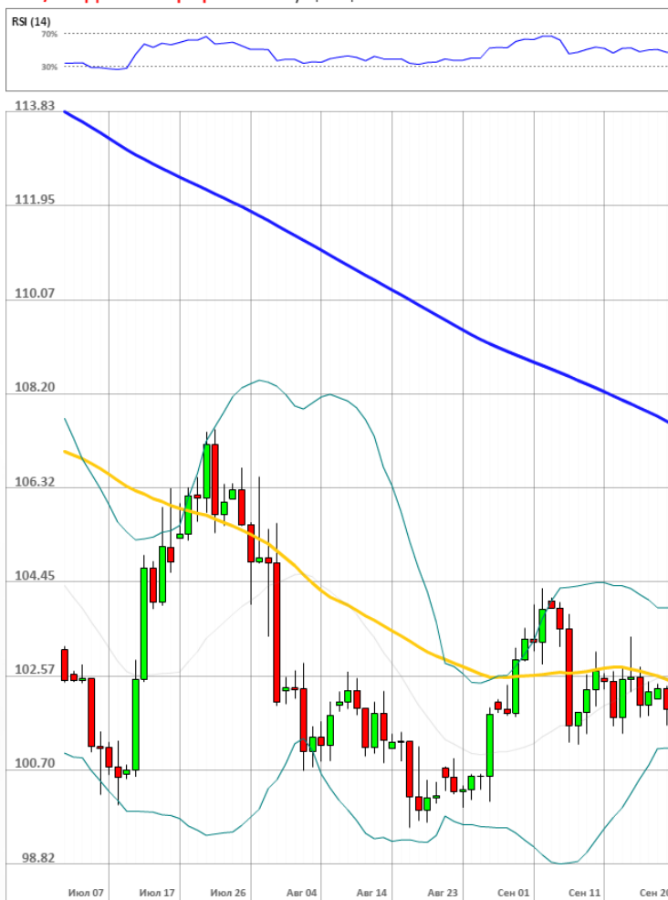
USD/JPY Дневной график Текущая цена 101.83

Доля длинных позиций на рынке SWFX упала и на данный момент равняется 60%.