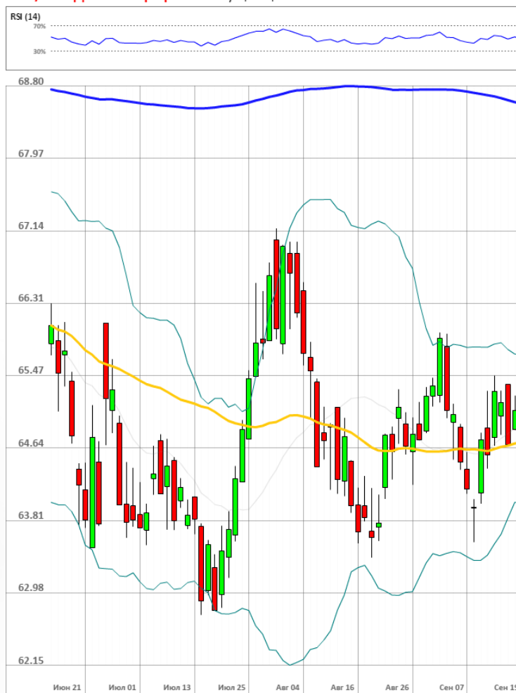
USD/RUB Дневной график Текущая цена 64.64