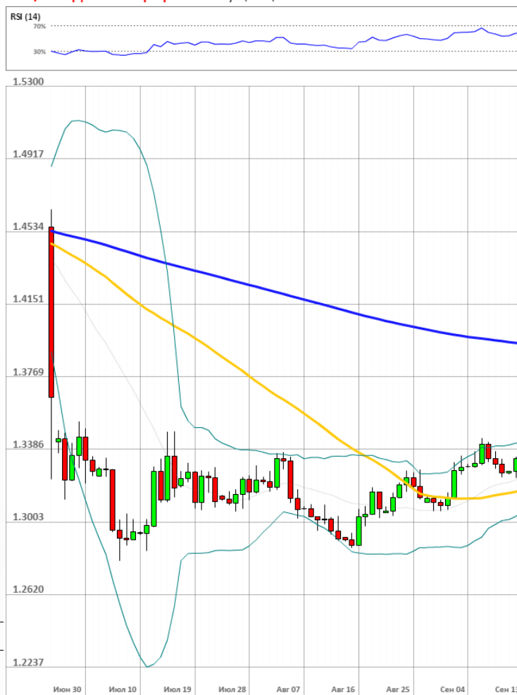
GBP/USD Дневной график Текущая цена 1.3318

Доля длинных позиций на рынке SWFX упала и на данный момент равняется 43%.