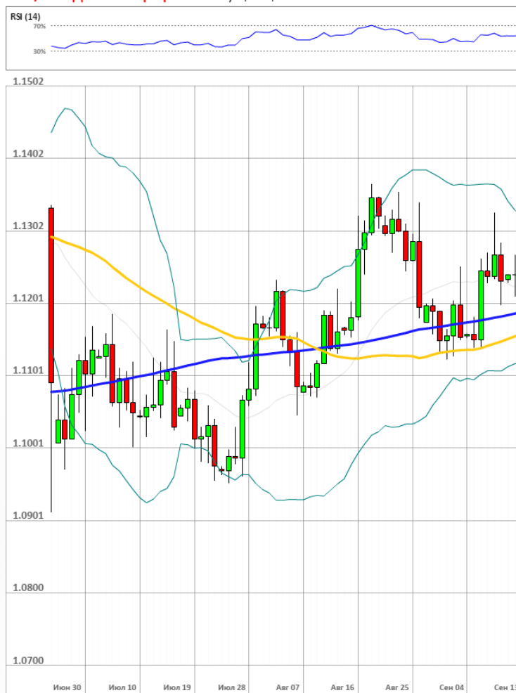
EUR/USD Дневной график Текущая цена 1.1229

Доля длинных позиций на рынке SWFX упала и на данный момент равняется 36%.