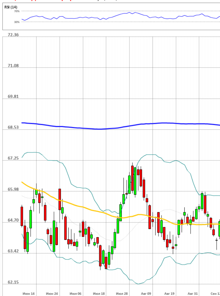
USD/RUB Дневной график Текущая цена 64.56