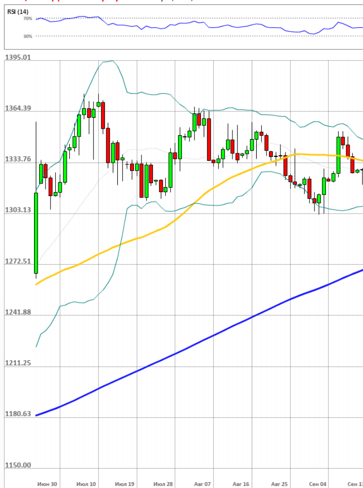
XAU/USD Дневной график Текущая цена 1329.02