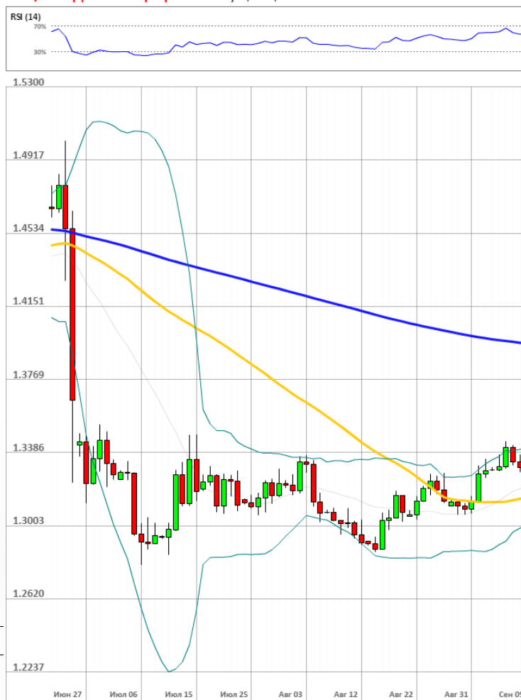
GBP/USD Дневной график Текущая цена 1.3313

Доля длинных позиций на рынке SWFX поднялась и на данный момент равняется 42%.