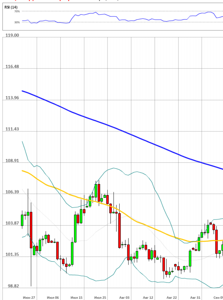
USD/JPY Дневной график Текущая цена 102.20