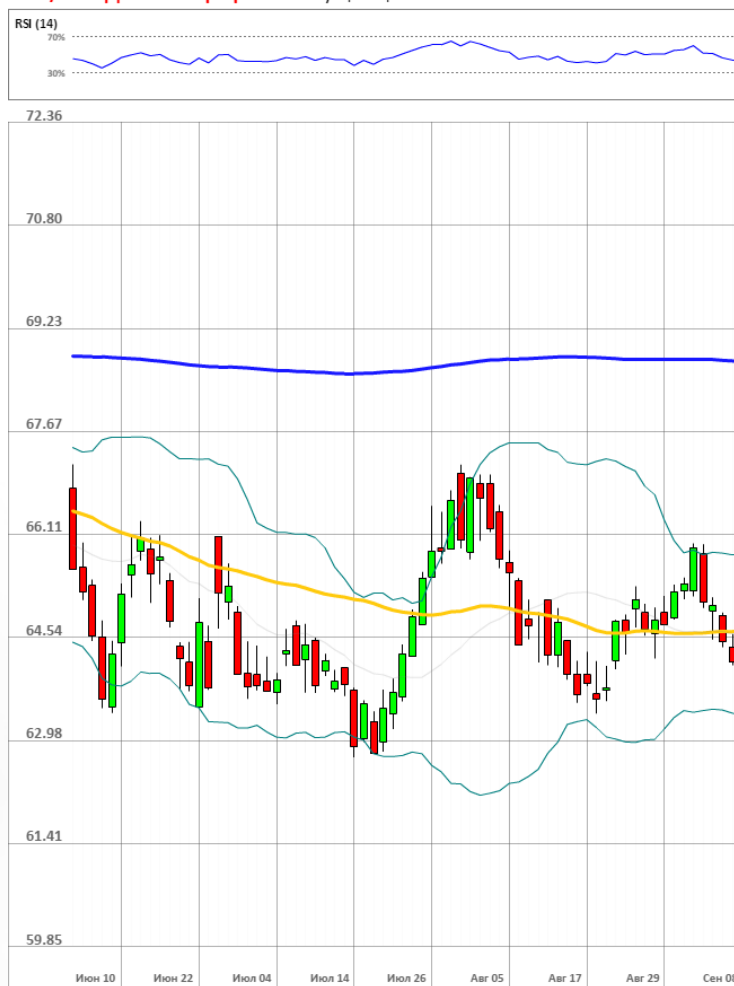
USD/RUB Дневной график Текущая цена 63.96