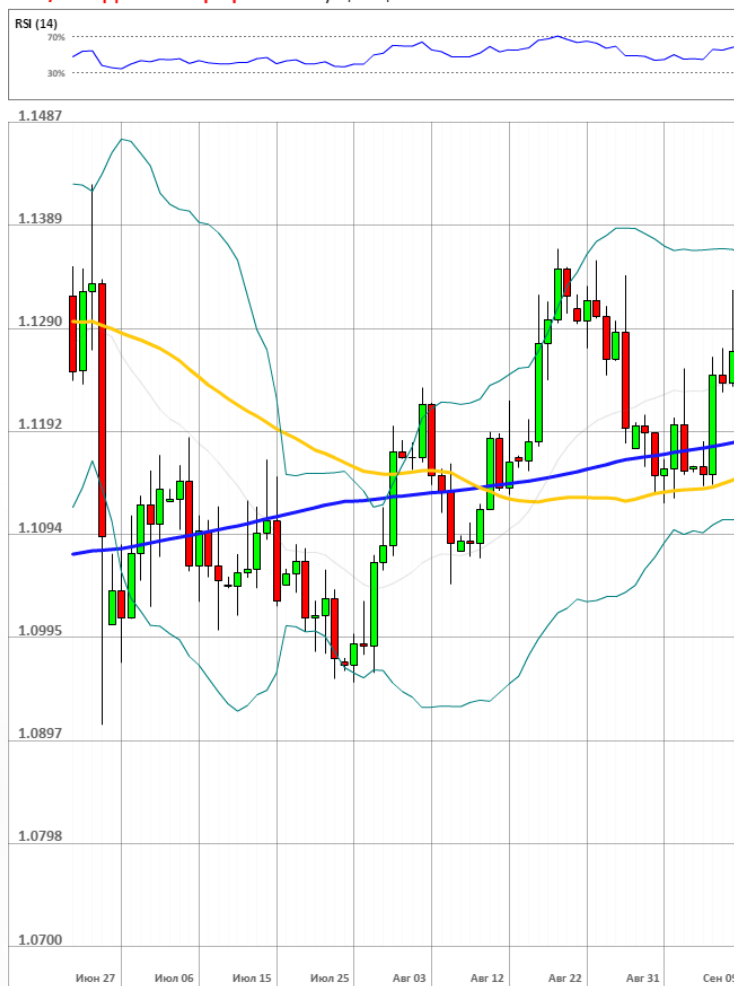
EUR/USD Дневной график Текущая цена 1.1272