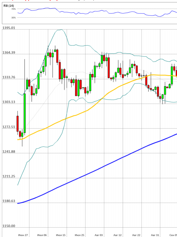
XAU/USD Дневной график Текущая цена 1335.59