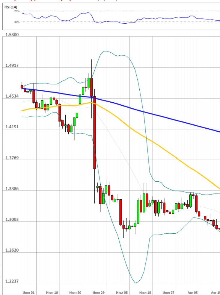
GBP/USD Дневной график Текущая цена 1.2927