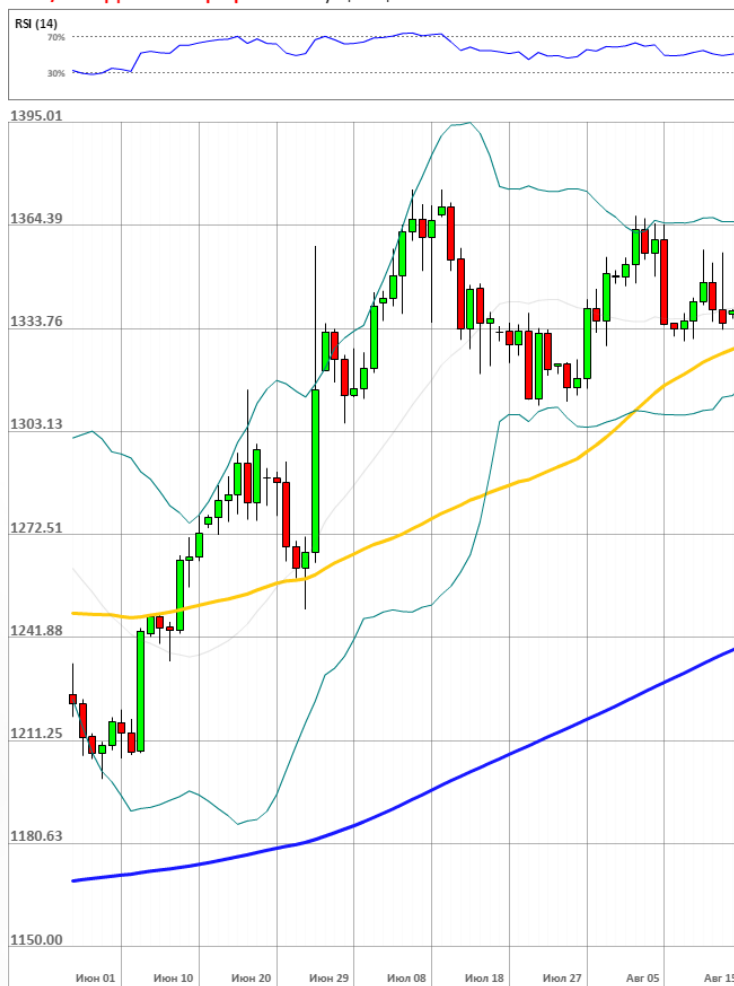
XAU/USD Дневной график Текущая цена 1339.28

Доля длинных позиций на рынке SWFX не изменилась и на данный момент равняется 48%.