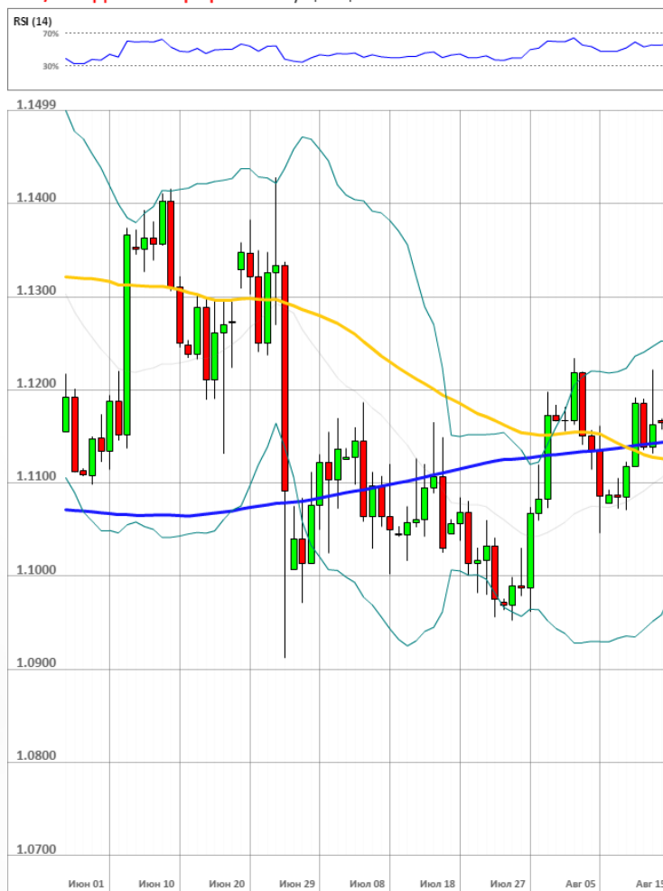
EUR/USD Дневной график Текущая цена 1.1162

Доля длинных позиций на рынке SWFX осталась неизменной и на данный момент равняется 42%.