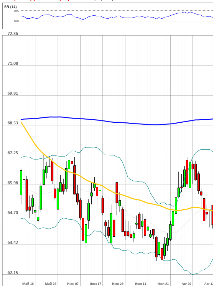
USD/RUB Дневной график Текущая цена 64.78