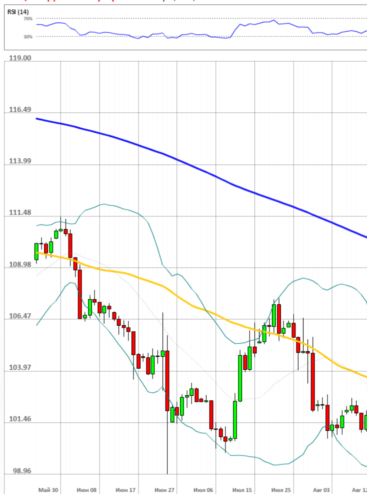
USD/JPY Дневной график Текущая цена 102.03