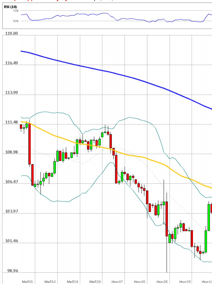
USD/JPY Дневной график Текущая цена 104.65

Доля длинных позиций на рынке SWFX упала и на данный момент равняется 61%.