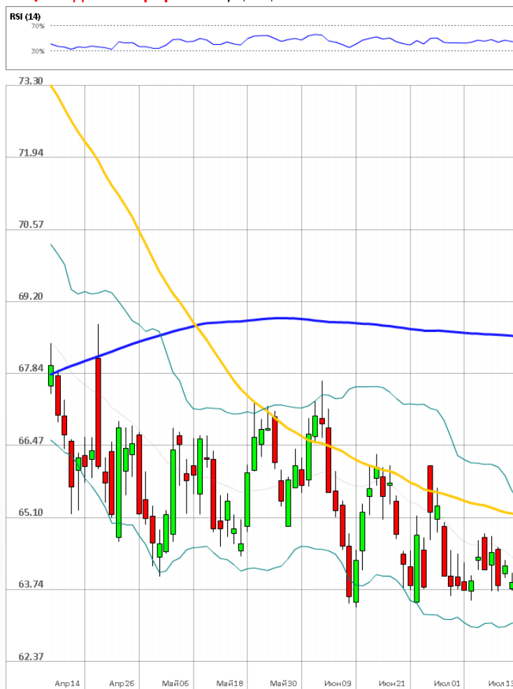
USD/RUB Дневной график Текущая цена 63.83