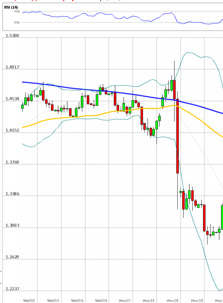
GBP/USD Дневной график Текущая цена 1.3190