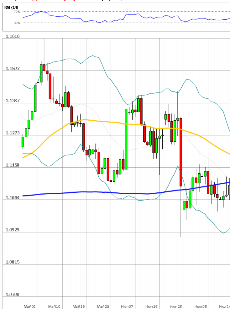
EUR/USD Дневной график Текущая цена 1.1107