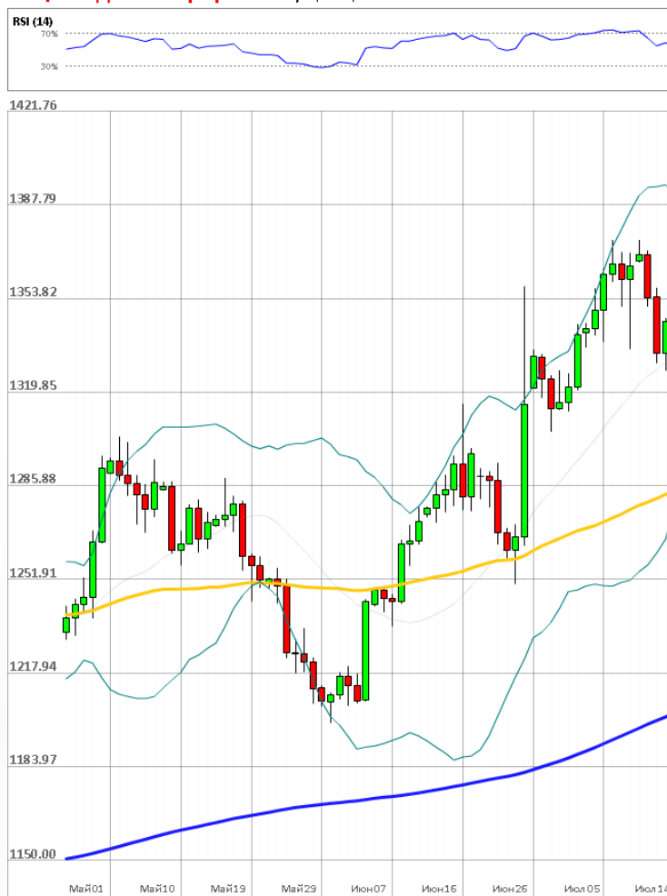
XAU/USD Дневной график Текущая цена 1337.79