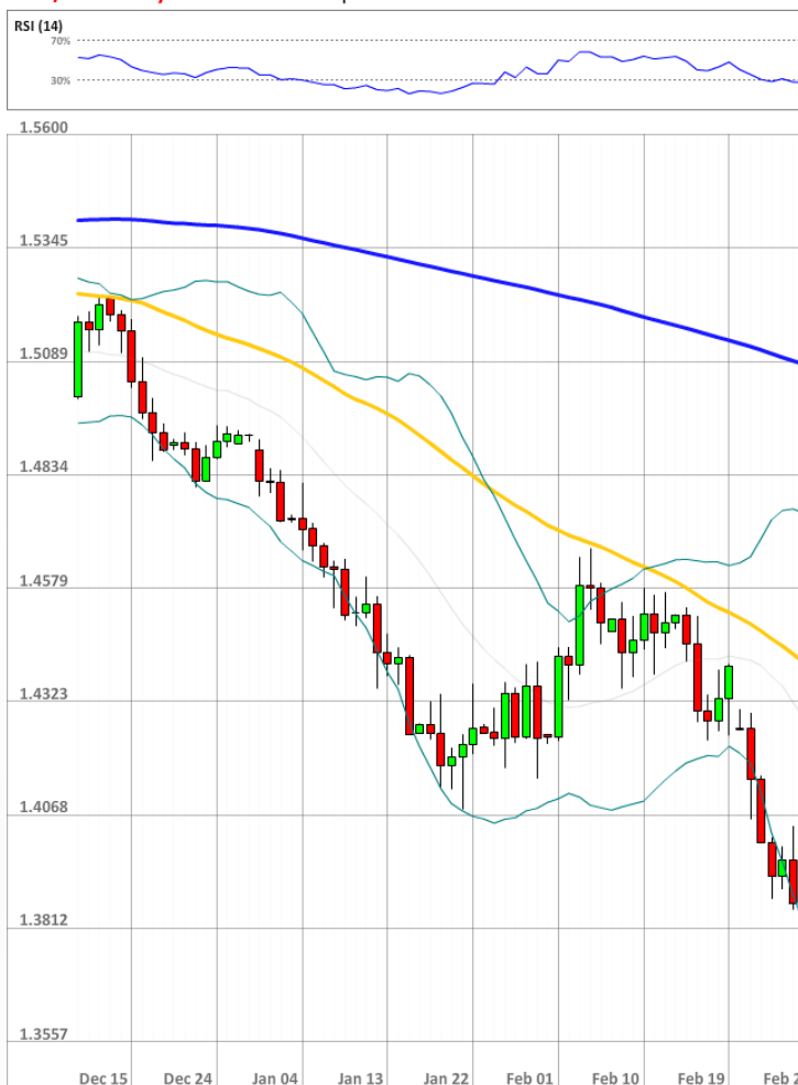
GBP/USD Daily Chart Current price: 1.3874

Настроение трейдеров SWFX остаётся бычьим - 65% (63% в пятницу). В то же время число ордеров, выставленных на покупку британской валюты, выросло на три процентных пункта до 58%.