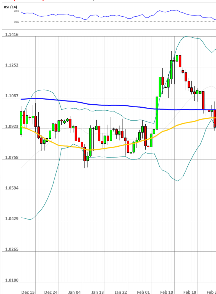
EUR/USD Daily Chart Current price: 1.0942

Быки рынка SWFX удерживают минимальное преимущество в два процентных пункта второй день подряд. Вдобавок к этому, примерно 55-58% ордеров выставлены на продажу евро против доллара.