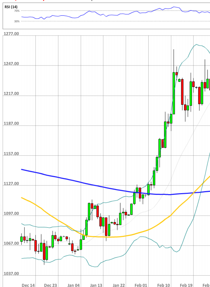
XAU/USD Daily Chart Current price: 1228.07

В то время как доля быков на рынке не изменилась - 27%, это означает, что большинство участников рынка SWFX ожидают падения курса. В то же время такое негативное настроение может способствовать увеличению бычьих позиций в ближайшем будущем.