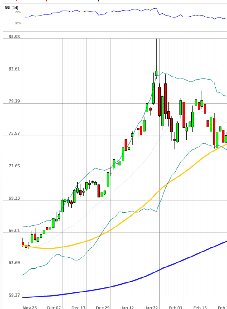
USD/RUB Daily Chart Current price: 75.28

Тем временем, доллар США остаётся в значительной степени перекупленным. По данным банка, почти три четверти участников рынка держат длинные позиции по USD/RUB.