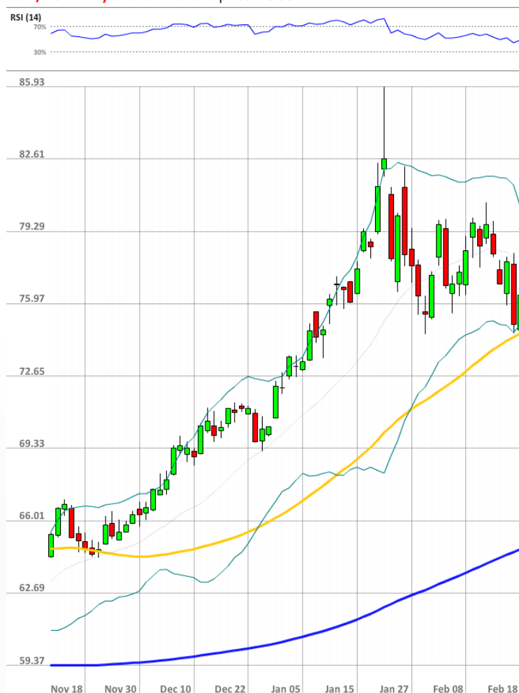
USD/RUB Daily Chart Current price: 76.38

На данный момент семь из каждых десяти участников рынка SWFX держат длинные позиции по доллару против рубля.