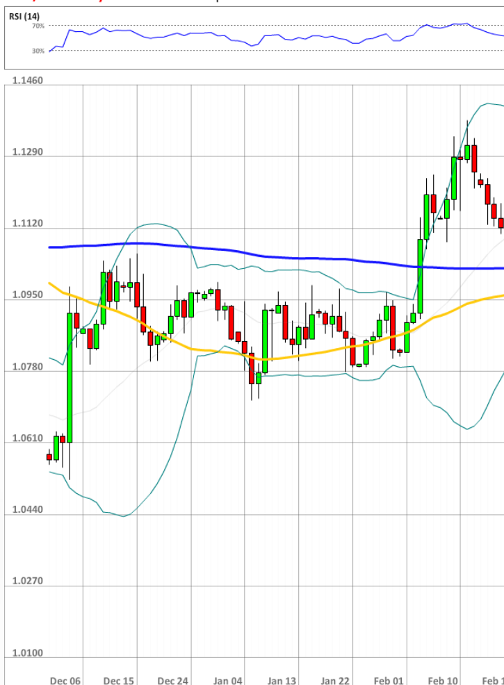
EUR/USD Daily Chart Current price: 1.1123

В третий день подряд преимущество коротких трейдеров перед длинными составляет десять процентных пунктов, тогда как такие отложенные ордера то же слегка медвежьи (52-53%) по евро.