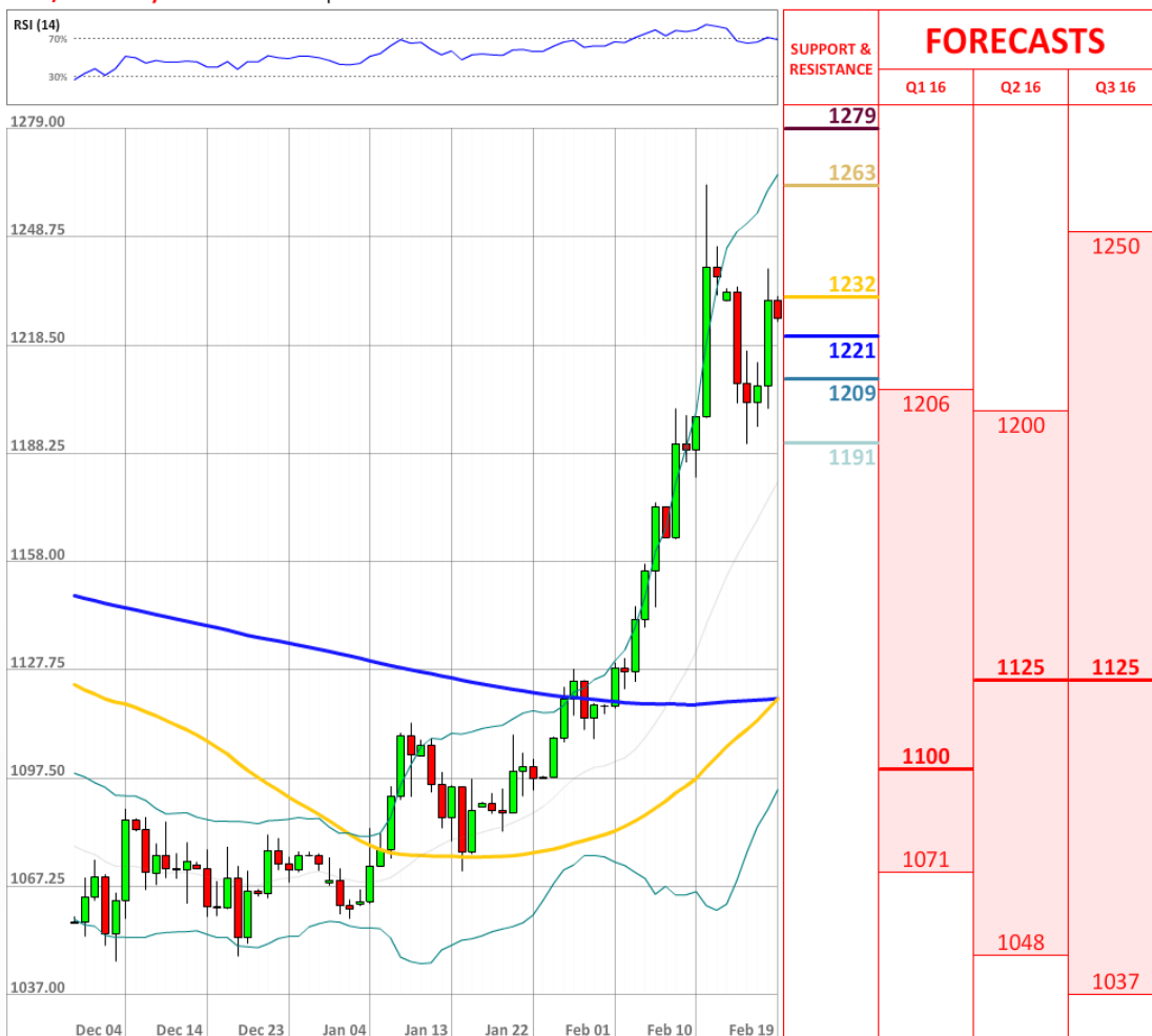
XAU/USD Daily Chart Current price: 1225.92

Два дня назад доля бычьих позиций на рынке SWFX выросла с 27% до 33%, вчера она отскочила до 32%.