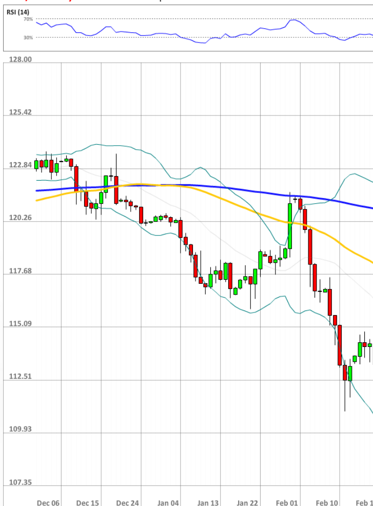
USD/JPY Daily Chart Current price: 113.06

Доллар США кажется перекупленным, поскольку 71% открытых позиций длинные. Доля же ордеров на продажу подскочила с 32% до 69%.