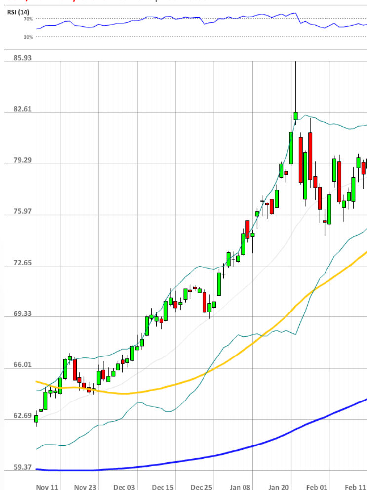
USD/RUB Daily Chart Current price: 79.59

Три четверти трейдеров SWFX сейчас держат длинные позиции по паре USD/RUB, что значительно выше вчерашних 63%.