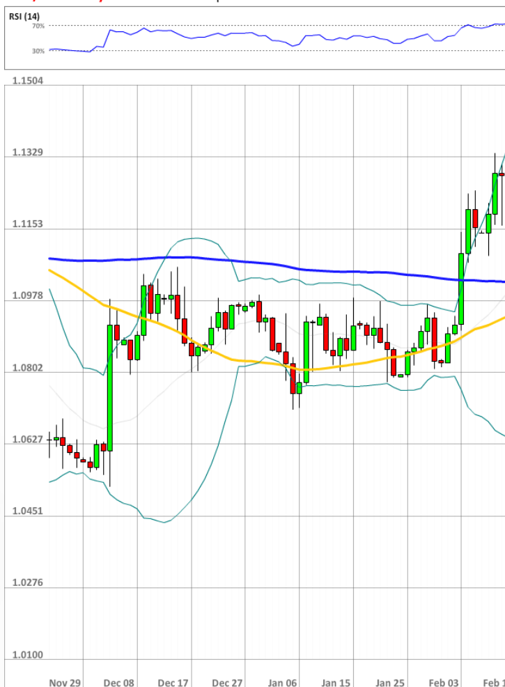
EUR/USD Daily Chart Current price: 1.1306