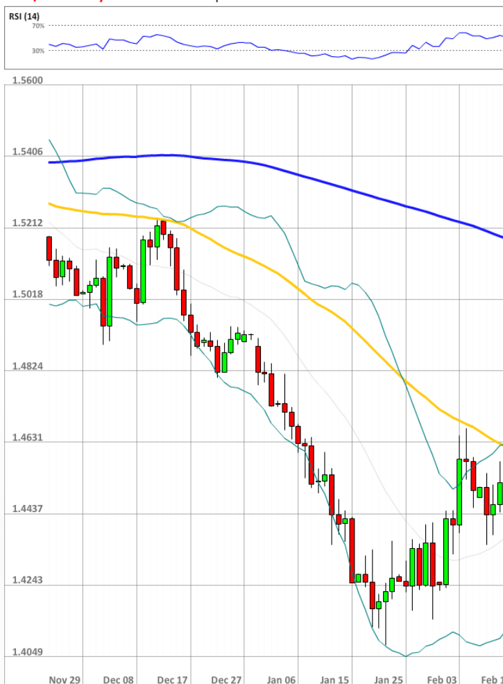
GBP/USD Daily Chart Current price: 1.4467

Сегодня 56% трейдеров по-прежнему придерживается позитивного прогноза для фунта. Между тем, доля ордеров на покупку увеличилась с 45% до 47%.