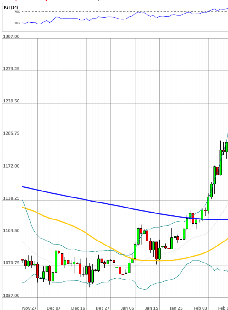
XAU/USD Daily Chart Current price: 1239.27

В последние четыре дня распределение бычьих и медвежьих позиций составляет 43-57%, тем самым сохраняется наибольшее медвежье преимущество за более, чем год.