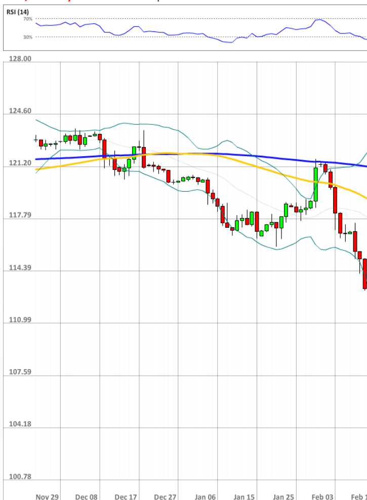
USD/JPY Daily Chart Current price: 112.36

Количество быков немного превышает количество медведей, так как 52% всех открытых позиций длинные, как было и вчера. Доля же ордеров на покупку, с другой стороны, резко увеличилась с 50% до 62%.