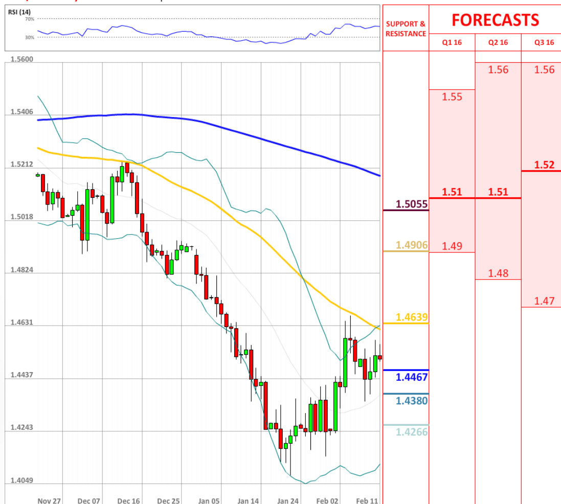
GBP/USD Daily Chart Current price: 1.4508

Бычье настроение трейдеров вернулось на вторичный уровень, то есть на 54%, тогда как доля ордеров на продажу увеличилась на четыре процентных пункта до 55%.