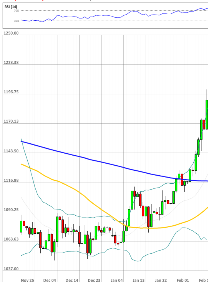
XAU/USD Daily Chart Current price: 1190.83

После падения под порог 50% впервые за более чем год доля бычьих участников рынка SWFX продолжает составлять 43%.