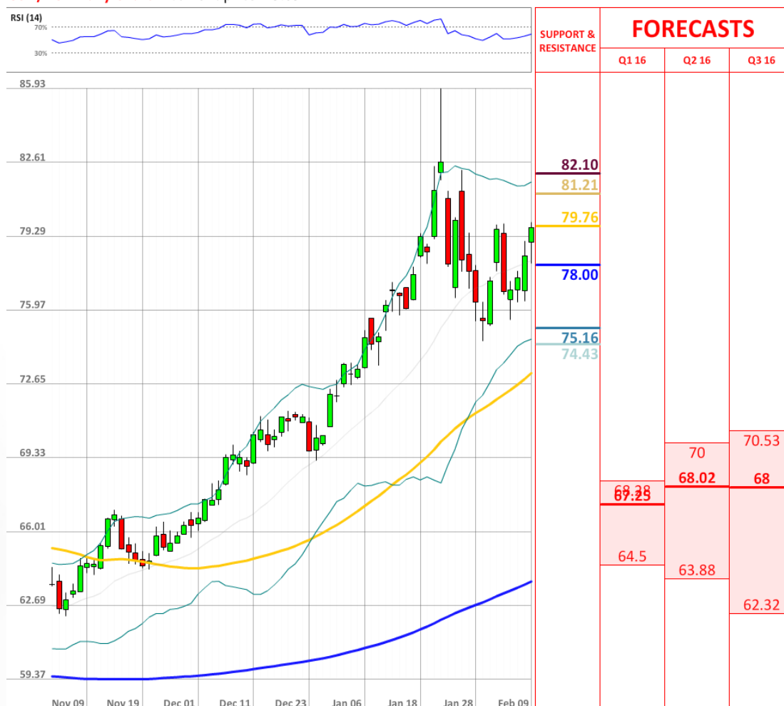
USD/RUB Daily Chart Current price: 79.69

Часть быков сумела восстановить потери на рынке SWFX, так как их общая доля выросла с 65% до 69%.