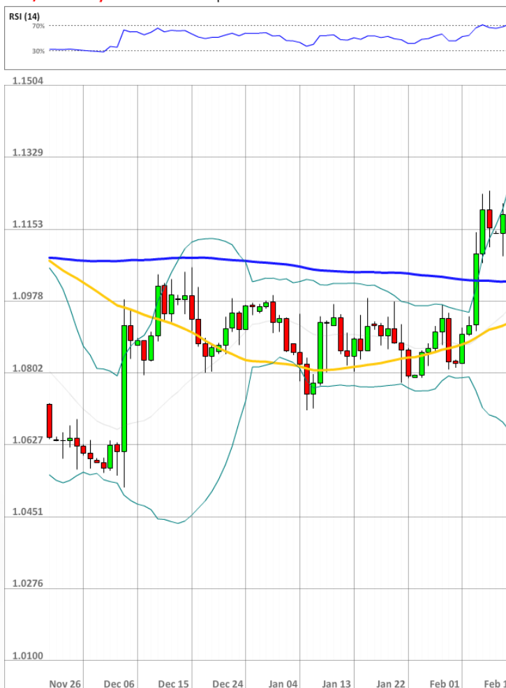
EUR/USD Daily Chart Current price: 1.1295

Вчера доля быков увеличилась лишь на один процентный пункт, дойдя до 39%. Между тем, бычья доля отложенных ордеров в 50 и 100 пунктах от текущего уровня цены уменьшилась до 47-48%.