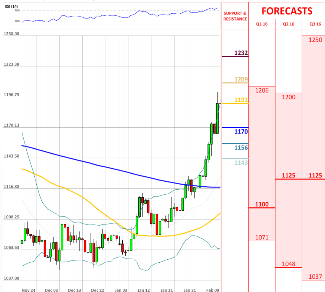
XAU/USD Daily Chart Current price: 1191.08

Вчера доля длинных позиций отступила до 43% с 50%, составив меньшинство впервые за три месяца и достигнув минимального уровня за более чем год.