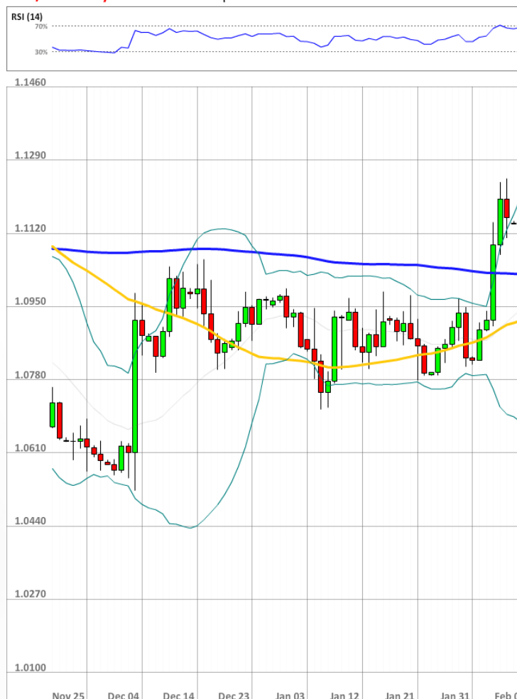
EUR/USD Daily Chart Current price: 1.1204

62% участников рынка продолжает ставить на падение евро против американского доллара, пусть даже 67% отложенных заказов поставлено на покупку европейской валюты в 100 пунктах от текущего уровня цены.