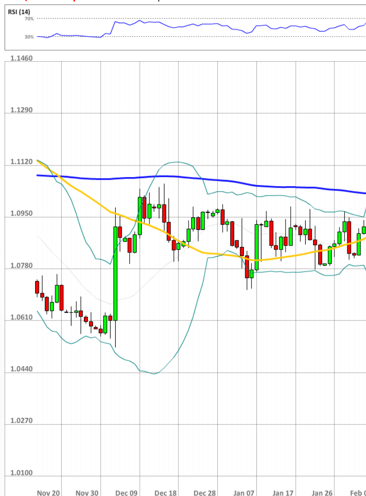
EUR/USD Daily Chart Current price: 1.1087

Доля длинных позиций на рынке выросла до 45% (41% ранее). Вдобавок 60% отложенных ордеров выставлены на покупку единой валюты в пределах 100 пунктов от спота.