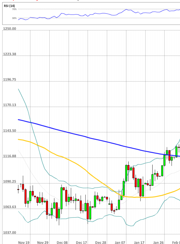
XAU/USD Daily Chart Current price: 1142.45

За последние 24 часа доля длинных позиций на рынке SWFX упала на два процентных пункта до 53% с 55%.