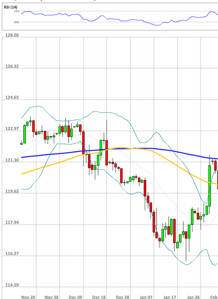
USD/JPY Daily Chart Current price: 117.94

Довольно интересно, что резкое падение не повлияло на распределение между короткими (69%) и длинными (31%) позициями. В то же время, доля ордеров, выставленных на продажу, упала с 75 до 55%.