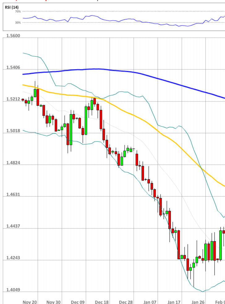
GBP/USD Daily Chart Current price: 1.4571

Число длинных позиций выросло на 12 процентных пунктов, однако настроение является нейтральным - 55% трейдеров являются быками, а 45% - медведями. В то же время доля ордеров, выставленных на продажу, выросла с 56 до 61%.