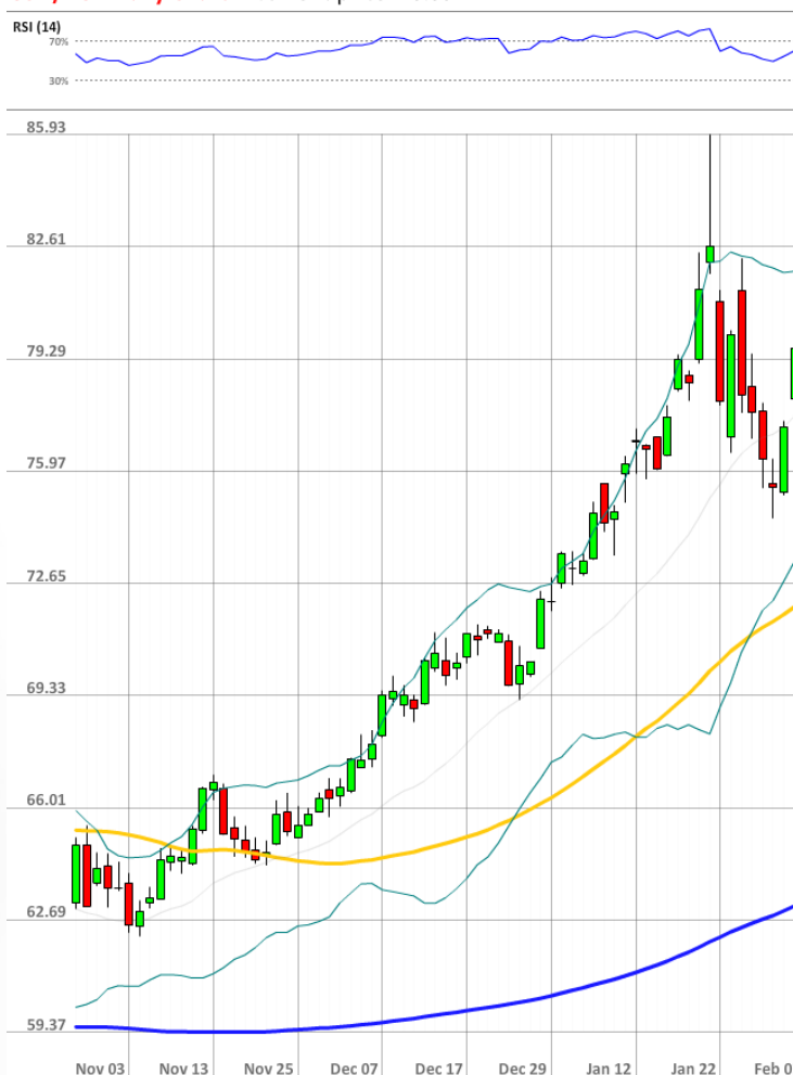
USD/RUB Daily Chart Current price: 76.80

Рынок полностью восстановил потери последних двух дней, и доля быков вернулась на уровень 70% (вчера 47%).