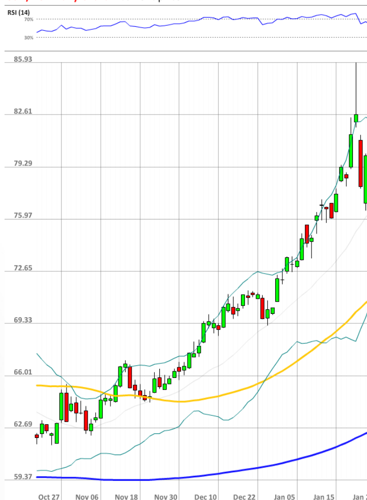
USD/RUB Daily Chart Current price: 77.71

Настроение трейдеров рынка SWFX улучшилось за последние 24 часа, так как доля длинных позиций выросла с 70% до 74%.