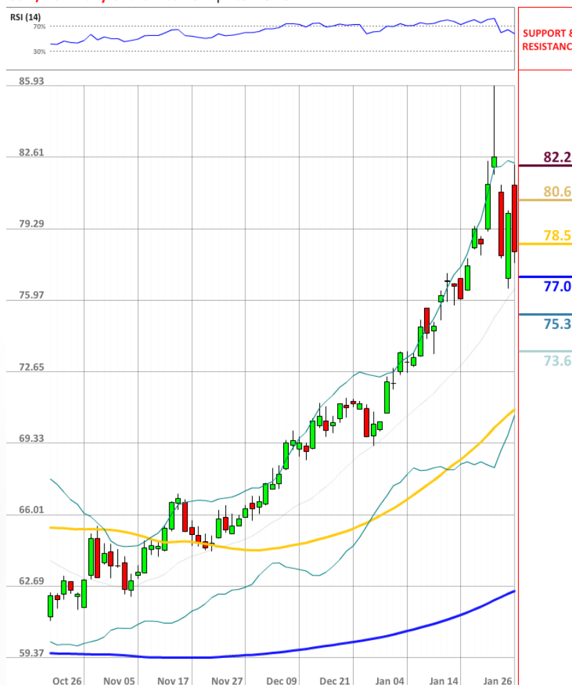
USD/RUB Daily Chart Current price: 78.23

Настроение трейдеров рынка SWFX снизились еще на один процентный пункт с 71% до 70% в пользу быков.