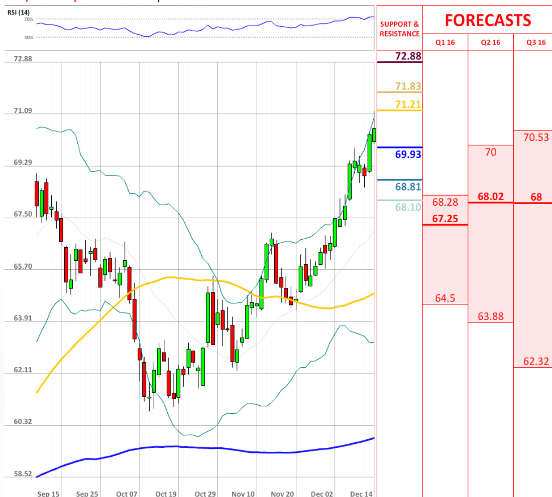
USD/RUB Daily Chart Current price: 70.57

Трейдерам продолжают отдавать предпочтение доллару США, так как доля длинных позиций находится уверенно выше 70%, а именно на уровне 72%.