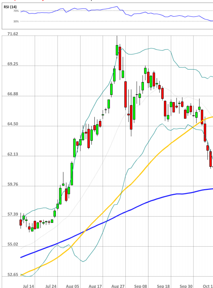
USD/RUB Daily Chart Current price: 62.22