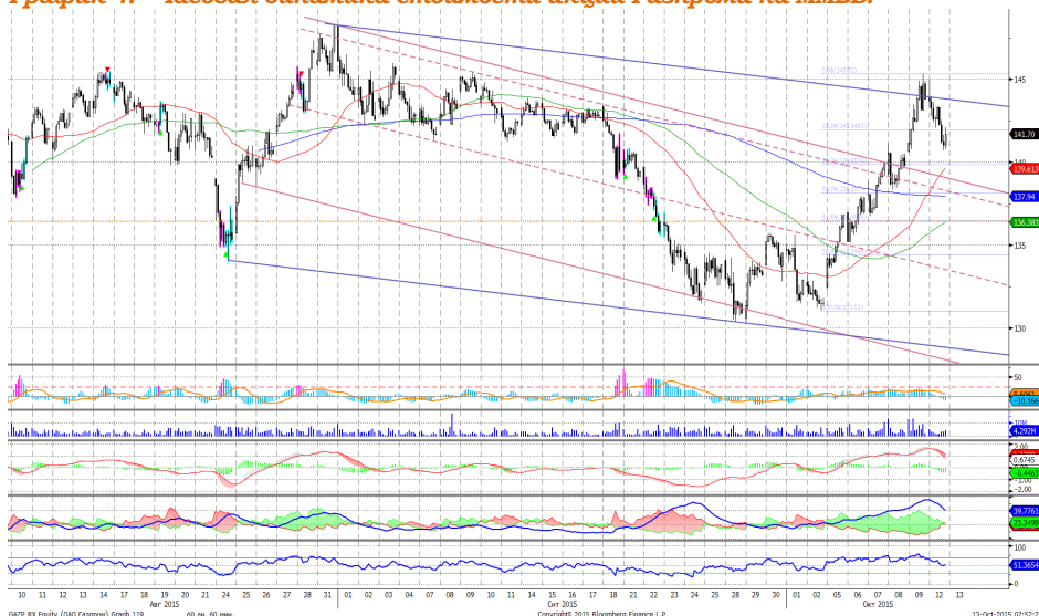
График 4. Часовая динамика стоимости акций Газпрома на ММВБ.

Газпром – встретил сопротивление, коррекционное снижение.