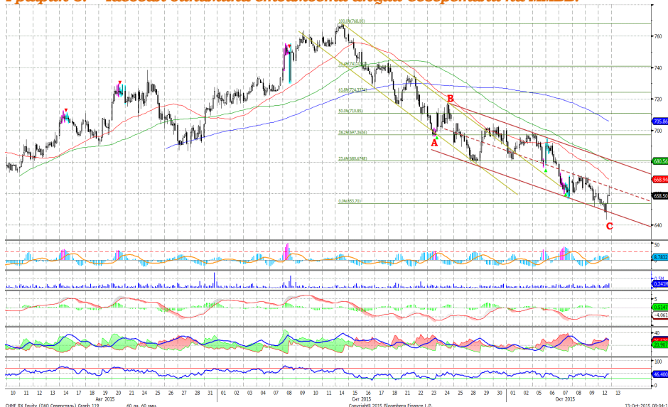
График 5. Часовая динамика стоимости акций Северстали на ММВБ.

Северсталь – завершила формирование коррекционной структуры, достигнув уровня поддержки, направилась вверх.