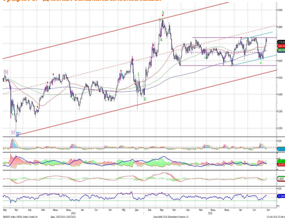
График 1. Дневная динамика Индекса ММВБ.