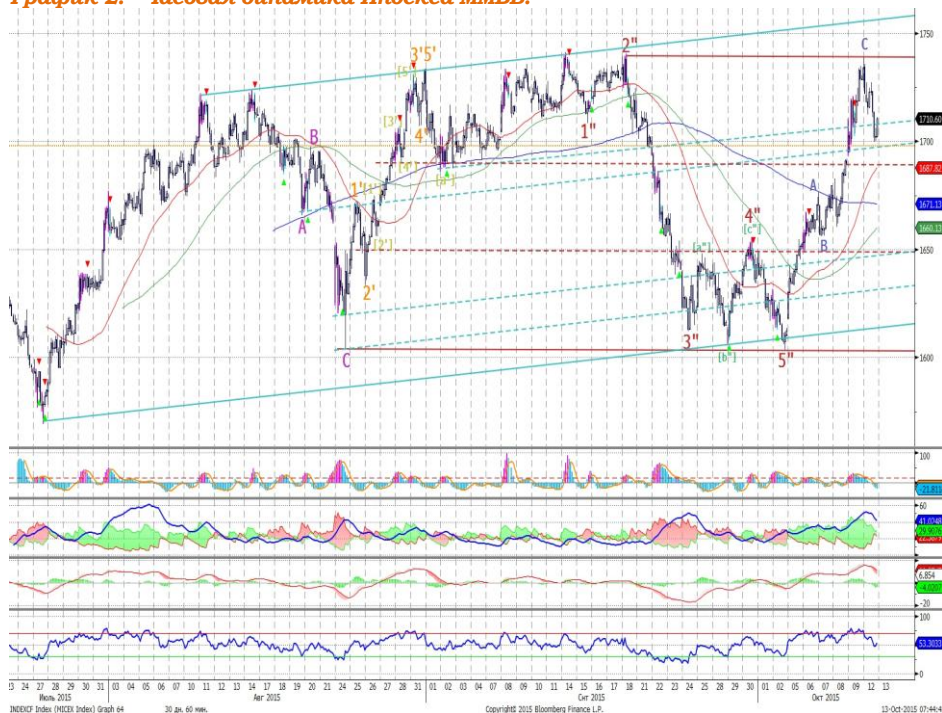
График 2. Часовая динамика Индекса ММВБ.

MACD выглядит нейтрально. DMI+ выше DMI-, ADX в средней части шкалы и разворачивается вверх, что говорит о зарождении восходящего тренда. Осциллятор RSI приблизился к области перекупленности, сигналов нет. Индикатор, основанный на динамике ADX, в настоящее время выглядит нейтрально.