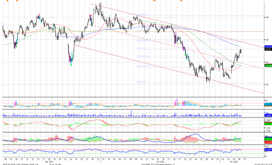
График 4. Часовая динамика стоимости акций Газпрома на ММВБ.