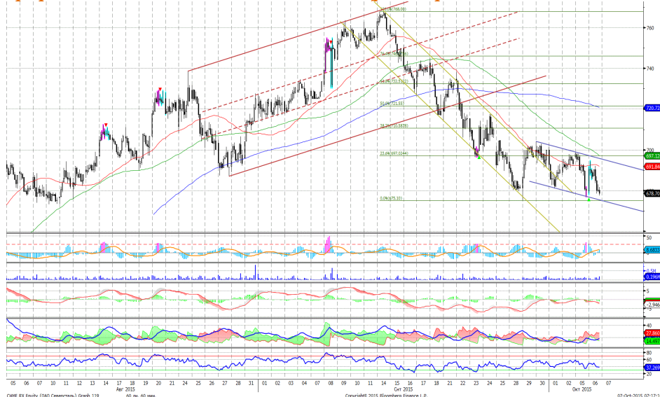
График 5. Часовая динамика стоимости акций Северстали на ММВБ.