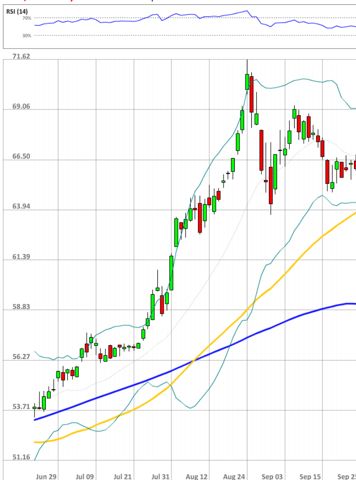
USD/RUB Daily Chart Current price: 65.10