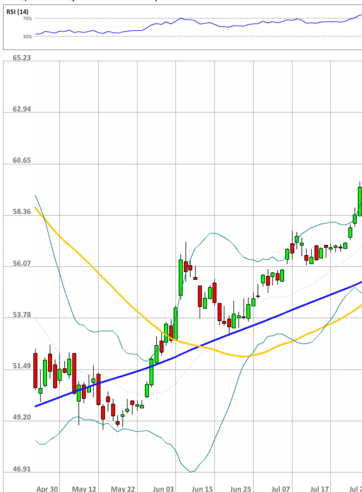
USD/RUB Daily Chart Current price: 58.63

Настроение на рынке остается отчетливо бычьим. Доля длинных позиций увеличилась до 73%.