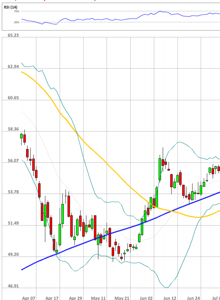
USD/RUB Daily Chart Current price: 56.85

Доля длинных позиций по паре USD/RUB выросла с 71% до 72% за последние 24 часа.