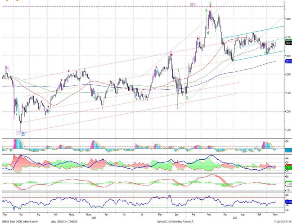
График 1. Дневная динамика Индекса ММВБ.

Индекс ММВБ – получил поддержку у нижней границы канала.