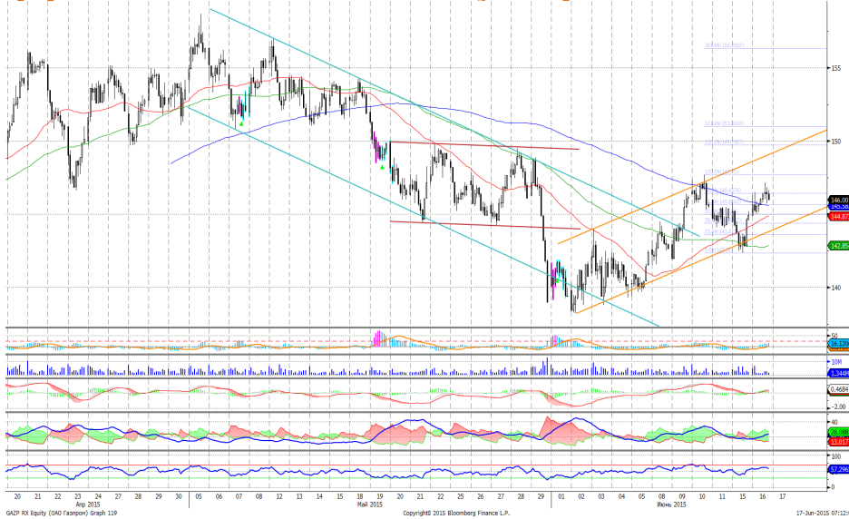
График 4. Часовая динамика стоимости акций Газпрома на ММВБ.

Газпром – направился вверх в пределах восходящего ценового коридора.