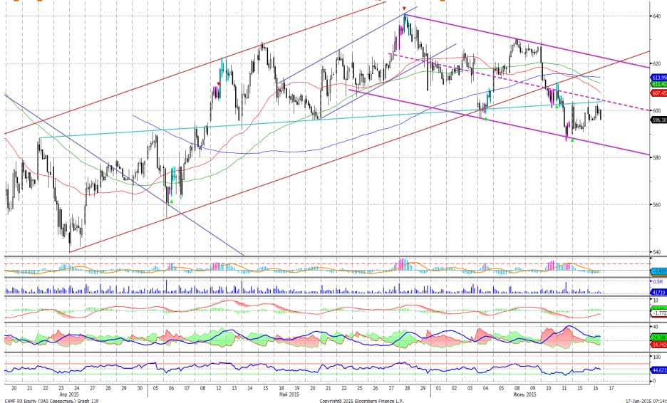
График 5. Часовая динамика стоимости акций Северстали на ММВБ.

Северсталь – достигла нижней границы умеренно нисходящего канала, где получила поддержку.