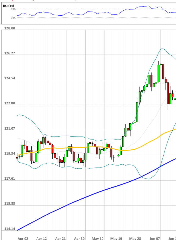
USD/JPY Daily Chart Current price: 123.57

Чуть больше трейдеров держат длинные позиции - 56% (55% ранее). В то же время ордера, выставленные на продажу, смогли вернуть большую часть позиций на рынке, но лишь 52%.