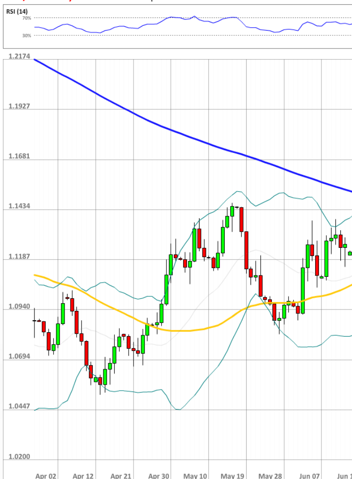
EUR/USD Daily Chart Current price: 1.1279

Разрыв между длинными и короткими позициями на рынке SWFX остаётся стабильным седьмой день подряд, так как быки по-прежнему держат 47% открытых позиций.