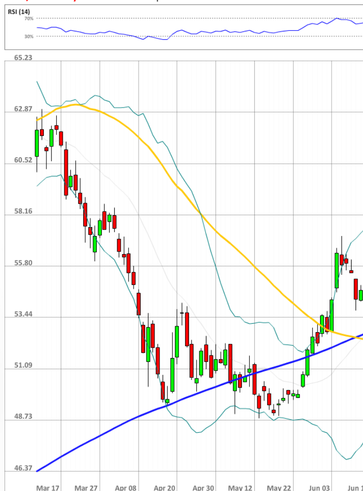
USD/RUB Daily Chart Current price: 54.48