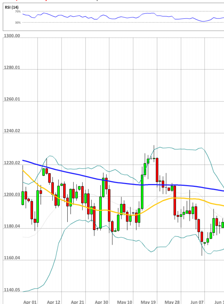
XAU/USD Daily Chart Current price: 1186.18

Преимущество быков над медведями на рынке SWFX за последние 24 часа сократилось на два процентных пункта, но доля длинных позиций всё же остаётся внушительной, и медведи по-прежнему находятся в меньшинстве.