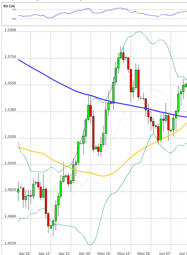
GBP/USD Daily Chart Current price: 1.5610

Быки продолжают уступать позиции, так как сегодня лишь 55% всех позиций являются длинными. В то же время доля ордеров, выставленных на покупку, выросла с 49 до 54%.