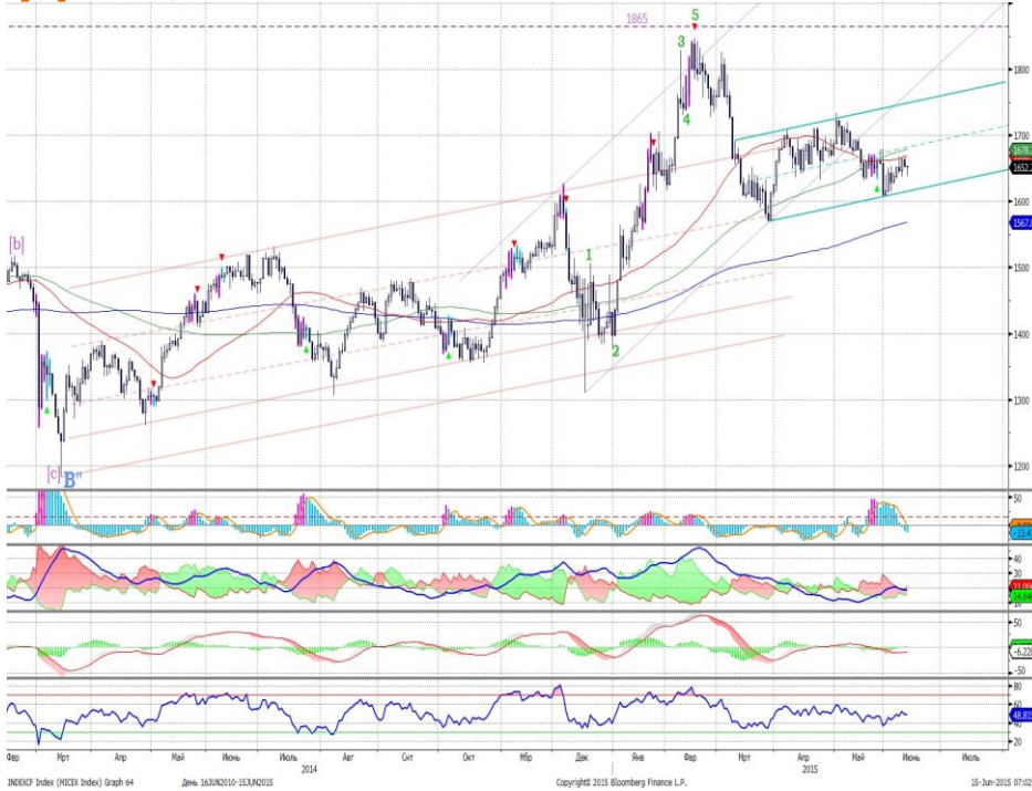
График 1. Дневная динамика Индекса ММВБ.

Индекс ММВБ – получил поддержку у нижней границы канала.