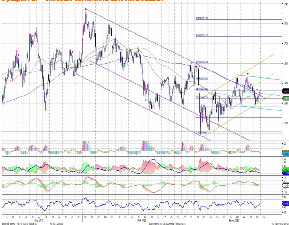
График 2. Часовая динамика Индекса ММВБ.

MACD формирует сигнал вверх. DMI+ и DMI- сошлись, ADX в средней части шкалы и направлен горизонтально, что говорит о прекращении нисходящего тренда. Осциллятор RSI в средней части шкалы, сигналов нет. Индикатор, основанный на динамике ADX, в настоящее время выглядит нейтрально.