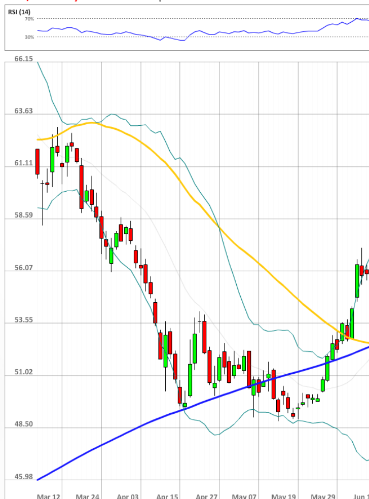
USD/RUB Daily Chart Current price: 54.29

Количество бычьих позиций по паре USD/RUB не изменилось за последние 24 часа и осталось на уровне 73%.