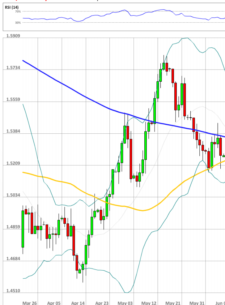
GBP/USD Daily Chart Current price: 1.5348

Длинные позиции в третий раз остаются неизменными, так как 59% трейдеров всё ещё придерживаются позитивного прогноза для фунта стерлингов. Количество ордеров на покупку пары выросло с 48% до 64%.