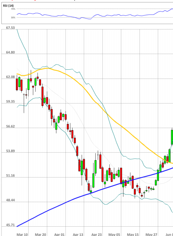
USD/RUB Daily Chart Current price: 55.94

Количество бычьих позиций по паре USD/RUB не изменилось за последние 24 часа и осталось на уровне 73%.