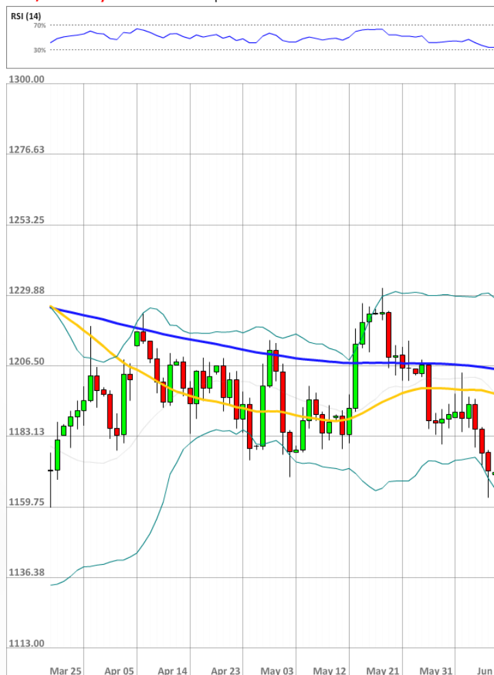
XAU/USD Daily Chart Current price: 1176.20