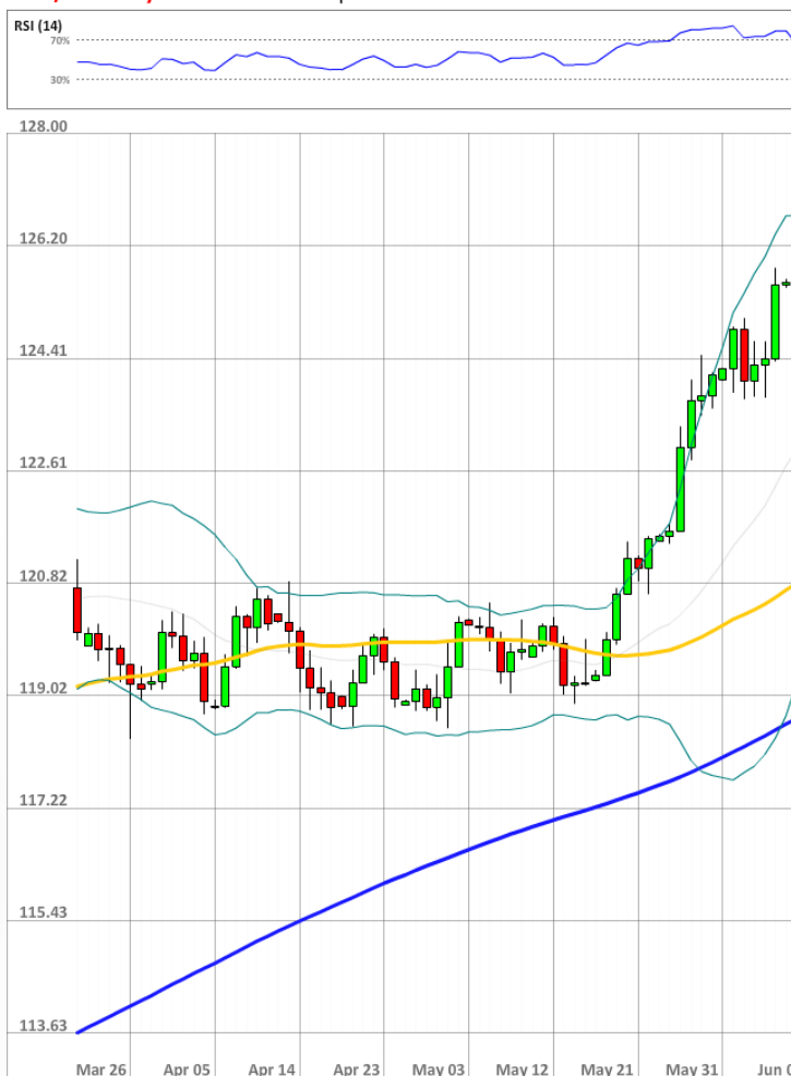
USD/JPY Daily Chart Current price: 124.55

В пятый раз подряд настроение трейдеров остаётся бычьим на 54%. Однако доля ордеров на покупку приблизилась к равновесию на 13 процентных пунктов, и теперь они занимают 52% рынка.