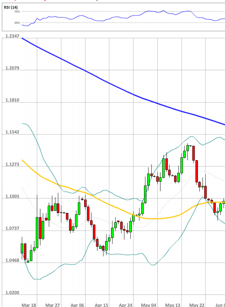
EUR/USD Daily Chart Current price: 1.0956

На данный момент разрыв между длинными и короткими позициями остаётся незначительным, так как быки держат 47% открытых позиций. Число ордеров, выставленных на покупку евро против доллара в пределах 100 пунктов от спота, за выходные значительно упало - до 37%.