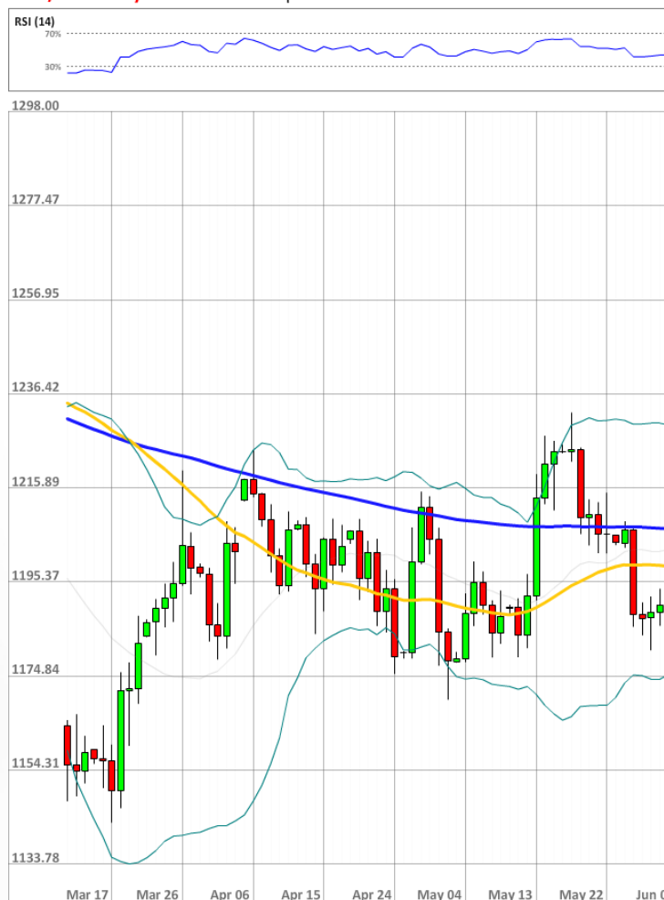
XAU/USD Daily Chart Current price: 1191.15

Преимущество быков над медведями на рынке SWFX остаётся сильным. За выходные общая доля длинных позиций выросла на два процентных пункта и в понедельник утром достигла 63%.