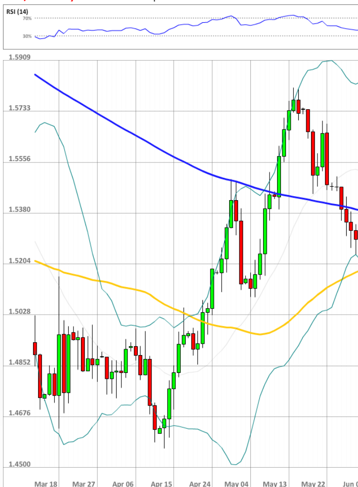
GBP/USD Daily Chart Current price: 1.5295

Доля быков увеличилась ещё на два процентных пункта до 49%, в то время как число ордеров, выставленных на покупку, упала с 60 до 52%.