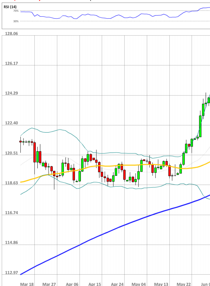
USD/JPY Daily Chart Current price: 124.10

Бычье настроение на рынке немного ослабло, так как сейчас 54% трейдеров держат длинные позиции (56% ранее). Доля ордеров, выставленных на покупку, выросла на три процентных пункта до 59%.