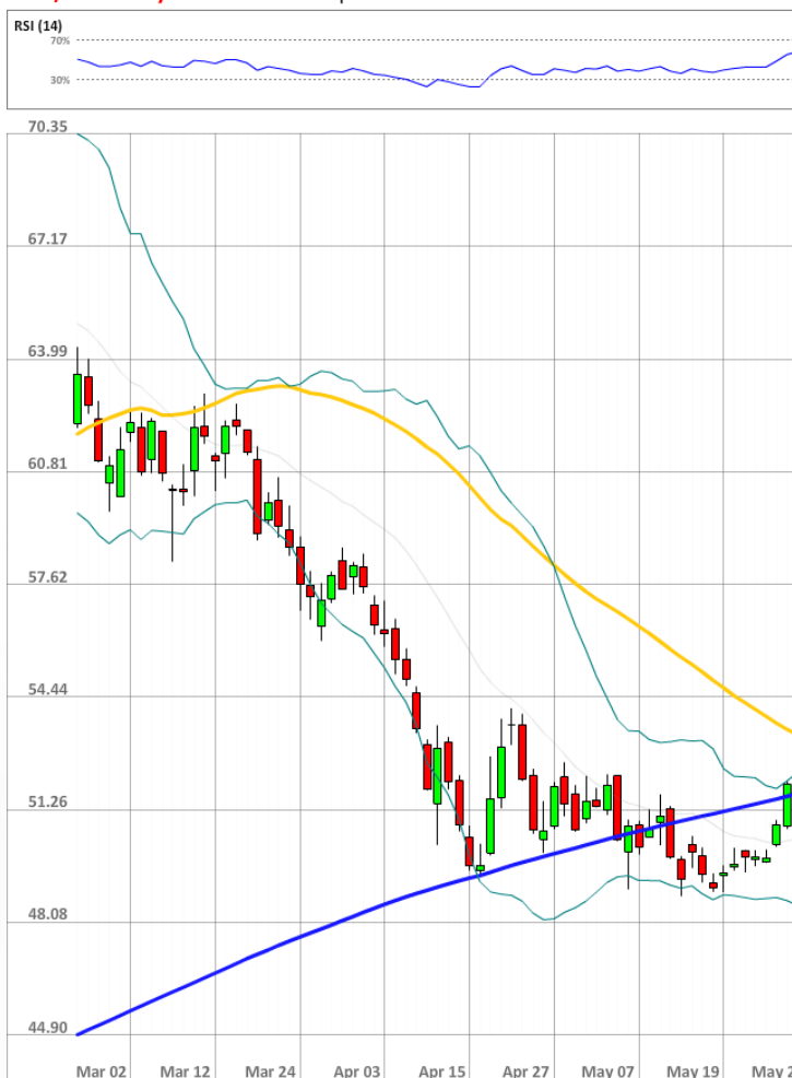
USD/RUB Daily Chart Current price: 52.27

На данный момент быки сохраняют значительное численное превосходство над медведями, занимая 72% всего рынка SWFX.