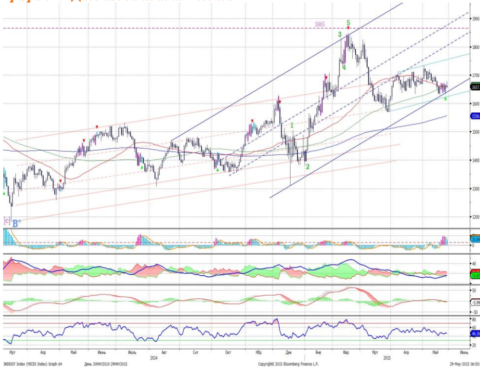
График 1. Дневная динамика Индекса ММВБ.

Индекс ММВБ – в нижней части восходящего канала.