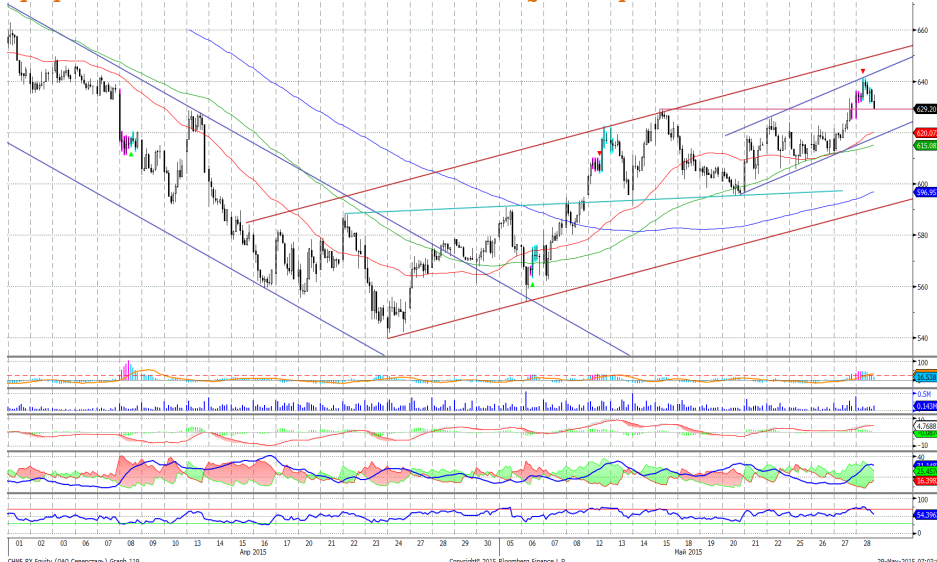
График 5. Часовая динамика стоимости акций Северстали на ММВБ.

Северсталь – в рамках умеренно восходящего ценового коридора.