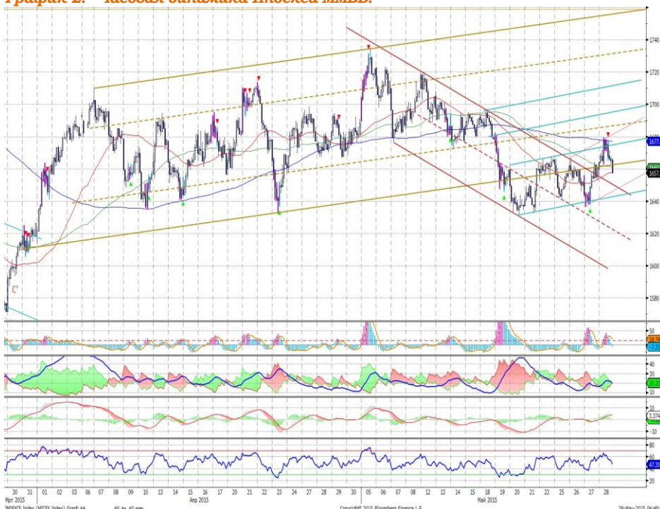
График 2. Часовая динамика Индекса ММВБ.

Индекс ММВБ – вышел за пределы нисходящего канала.